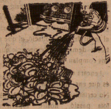
El marit, la dona del qual és a prendre les aigües, renta la vaixela.

Aquest és l'home en acció: un cor que bat amb força sense perdre el ritme; un front acalorat, però alt, que no declina en l'embriaguesa; un braç que s'aixeca amb gràcia igualment per a l'espasa que per al ram d'olivera; i tot el cos inclinat amb un peu cap endavant sense caure: tan bellament que no