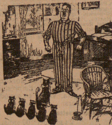
La gata del sargent major ha tingut gatets.