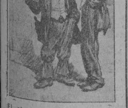
El obrero despedido.—Yo no se por qué me han echado. ¡Si no hiciera nada!

El primero y más convincente: que un lujo desde el momento que resulta casi inaccesible por su costo, deja de ser lujo asequible e indispensable y conviértese en joroba pesadísima que desfigura la línea sencilla y normal del cuerpo económico de cada cual. El segundo argumento puede ser muy bien el siguiente: «nosotros creemos que si la virtud del teléfono consiste, principalmente, en llevar una noticia con la mayor comodidad para el noticiante, de una a otra persona, o de una a varias personas, creemos, pueden ustedes repetir para mayor autoridad de la creencia, que mientras existan las porteras la solución es probable. Basta insinuar una noticia a una de estas respetables guardi-