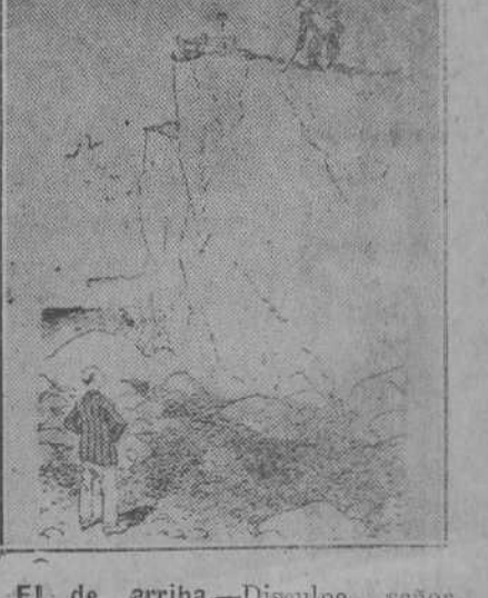
El de arriba.—Disculpe, señor. ¿Quisiera usted hacer el favor de buscar mi pelota de golf y tirarla hacia aquí?