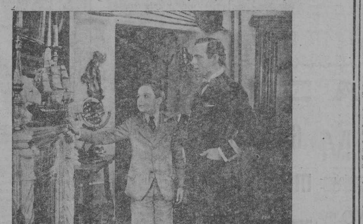
Una escena de MARE NOSTRUM, de Blasco Ibáñez, que hoy se estrena en el GRAN CINEMA.

Vertical text on the left margin, likely from an adjacent page or advertisement.