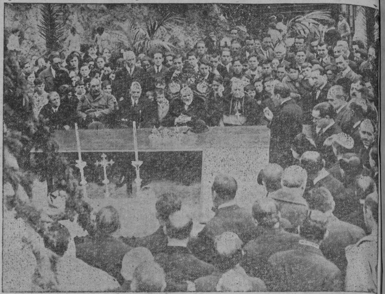
EL BRILLANTE ACTO DE AYER.—Un momento de la solemne ceremonia de colocación de la primera piedra del Grupo escolar Menéndez Pelayo.

Gustavo V descendió al andén y estuvo charlando con dichas per-