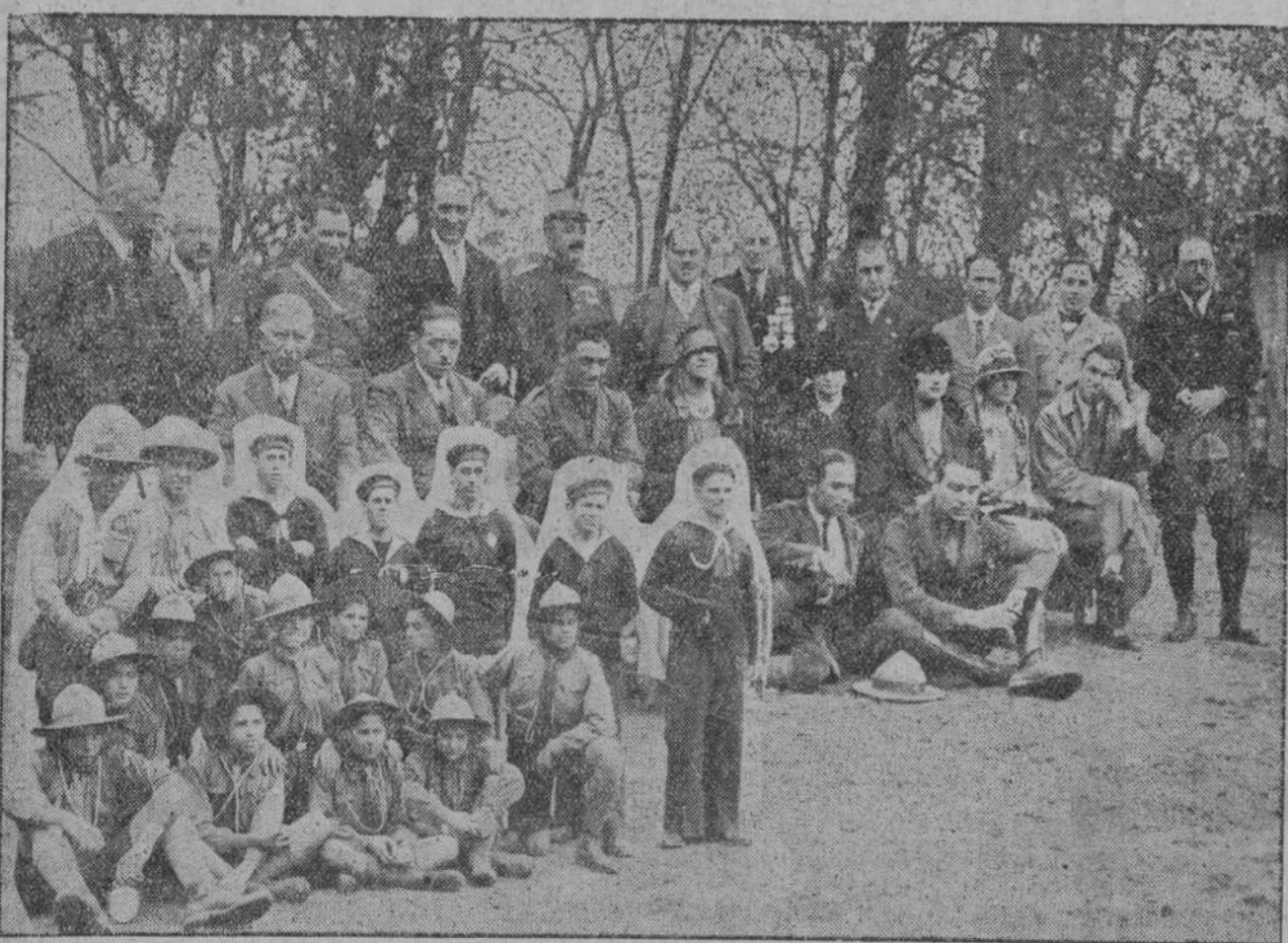
DE UN ACTO SIMPATICO.—El Consejo directivo de los Exploradores santanderinos, con otras personalidades asistentes al acto de entrega de premios por los ejercicios escultistas, celebrado el pasado domingo.—Grupo de los exploradores premiados.

El rápido y el mixto salieron a causa del accidente, con dos horas y cuatro, respectivamente, de retraso.