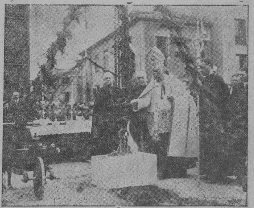
El señor obispo oficiando en el acto solemne de colocación de la primera piedra del Grupo escolar Menéndez Pelayo.

Dijo que en los programas administrativos y políticos, en asuntos primordial la construcción del nú-