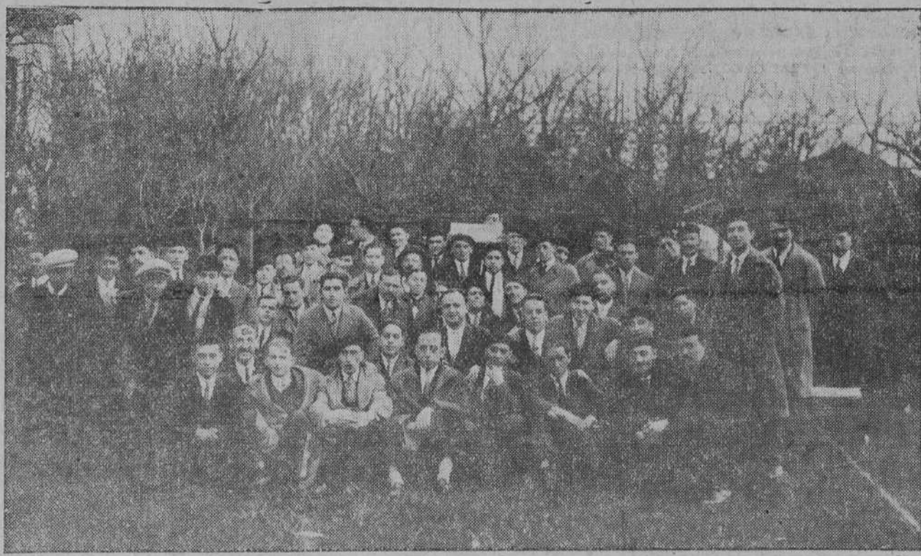
Concurrentes al banquete en que se reunieron los tipógrafos santanderinos para celebrar el XLIV aniversario de la fundación de «La Gráfica».

Para los primeros días de la próxima semana, se proyecta una fiesta artística, en la Sala Narbón, a beneficio de Acción Católica de la Mujer, esperada ya con impaciencia por el público que, conociendo algunos de los elementos que en ella han de figurar, se apresura a procurarse localidades aún antes de haber sido puestas a la venta. Y no es de extrañar la acogida entusiasta que ha tenido una idea tan halagüeña, que proporciona medio de contribuir a un fin benéfico a la vez que procurar el placer, logrado pocas veces, de admirar el arte de las señoritas de nuestra sociedad, dispuestas siempre a poner sus facultades al servicio de la caridad y de la cultura, aunque ello signifique trabajo y estudio, como el que vienen realizando, desde hace varias semanas, de composiciones de renombrados autores como J. Vázquez, Soto de Langa, L. Villalba, Schumann, Wagner, César Franck, Borodine, Saint-Saens, Guri y algunos otros, que han de ser cantadas en el anunciado concierto. Habrà otro número también de especial atractivo, constituido por un coro de niños que ejecutarán cantos regionales armonizados por el maestro Benedito, y una escogida sesión cinematográfica de gran interés, completará el programa. Pueden adquirirse las localidades en el domicilio de la señora de Manzarrasa, Peseo de Paveda, 30, primero; en el comercio de don Manuel Oruña, San Francisco, 11.