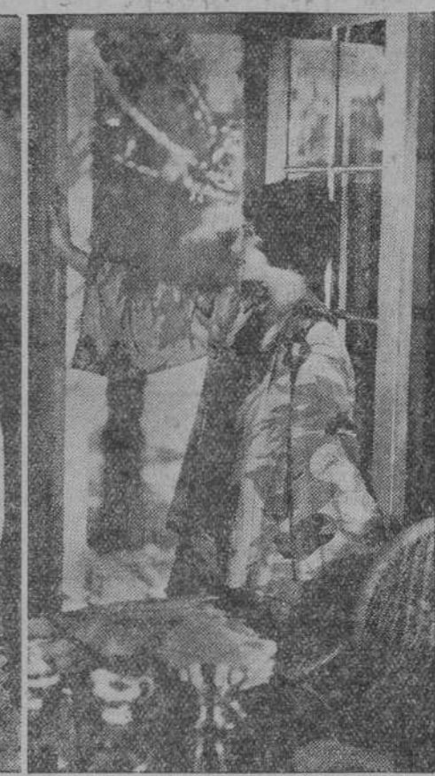
Norma Shearer, la genial «estrella» de la Metro-Goldwyn Mayer, en la intimidad.