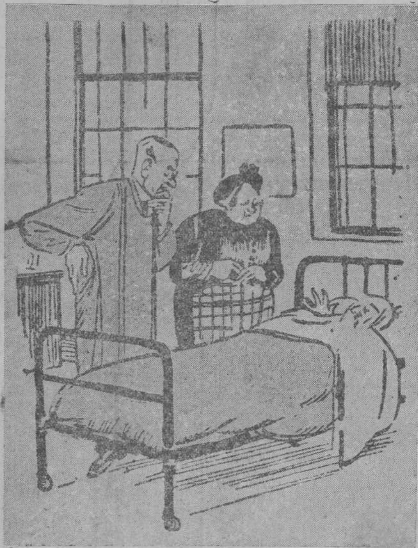
—EL MEDICO (inspeccionando a la victima de un accidente).— Debe estar muerto. (La victima murmura palabras ininteligibles.) LA ESPOSA DE LA VICTIMA.—¡Cállate, hombre, si lo sabrá el médico mejor que tú!.. (De «Cándido».)