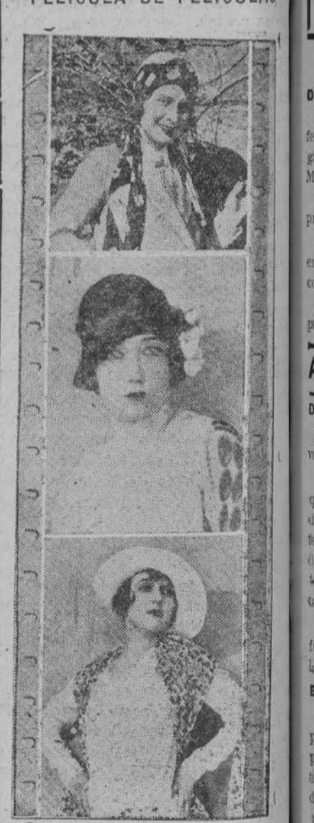
Norma Shearer, Dorothy Sebastian y Carmen Myers en tres caracterizaciones.

—Usted es joven y ha de verla. Acuérdese de mis palabras.