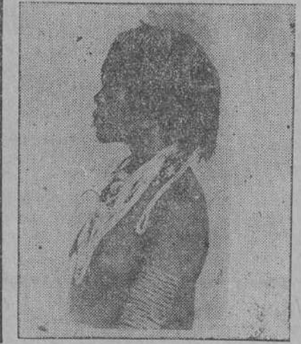
DE LA RUTA DE LA ESCUADRILLA ATLANTIDA.—Tipo de indígena de Lagos.

Bata, y en Fernando Póo un taller tipográfico montado por los Padres Misioneros del Corazón de María, en el cual se editaban el «Boletín Oficial» y una revista quincenal titulada «La Guinea Española».