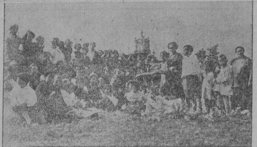
La típica y tradicional procesión saliendo de la hermosa capilla.—Las mozas de los «ramos» son obsequiadas en pleno campo por la Comisión.