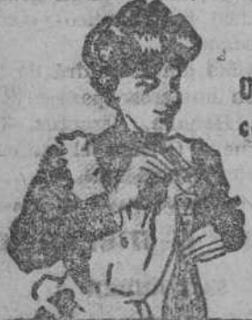
Una buena costumbre