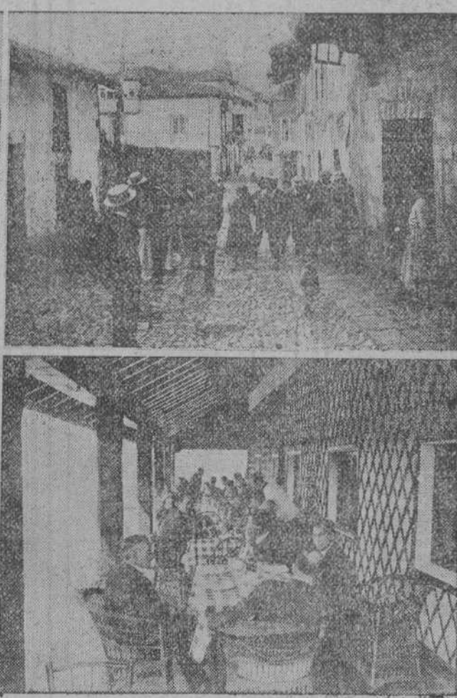
LOS TURISTAS AMERICANOS EN SANTILLANA Y COMILLAS.—La soberbia Colegiata, objeto de la admiración de los turistas.—Estos recorren complacidos las típicas calles de Santillana.—Una linda señorita expedicionaria juega al golf en Oyambre.—Los turistas son obsequiados con una espléndida comida.