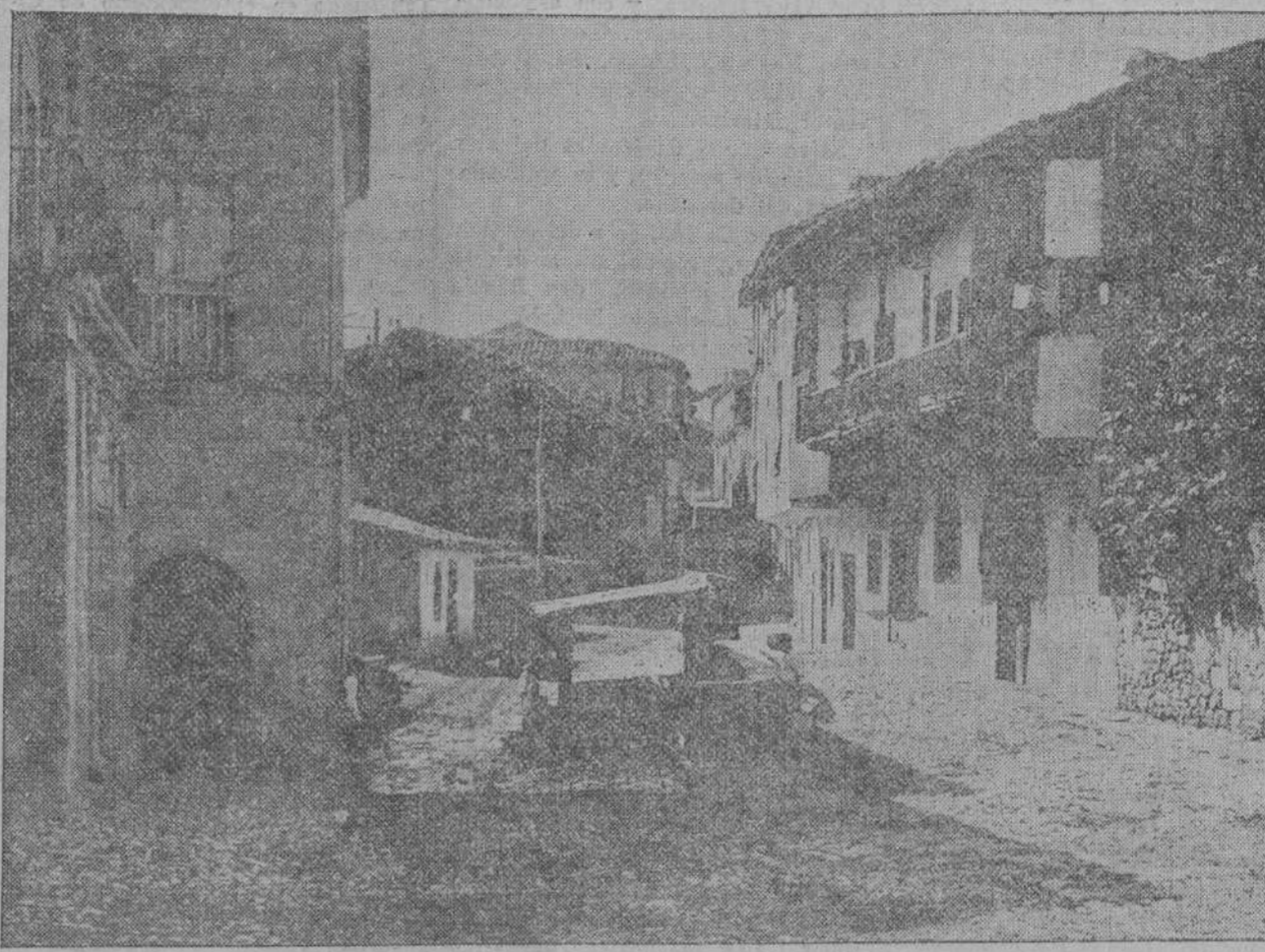
Una típica calle del interesante pueblo de Santillana del Mar, visitado este año por miles de turistas.