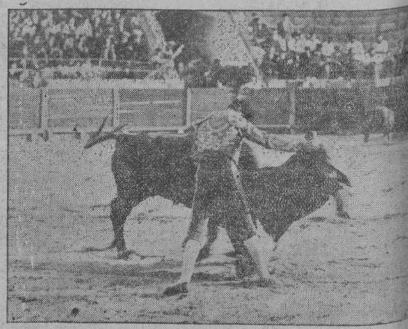
DE LA CORRIDA DE SANTÓN A.—Agüero torcando de capa a su primer toro.

Se encontraron numerosos folletos anarquistas, hojas sediciosas y más de dos millones de sellos de colección.