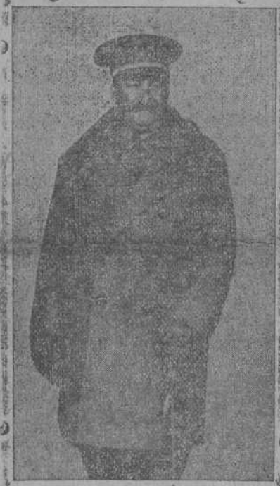
El general don Dámaso Berenguer, que ayer tomó posesión de su cargo de jefe del Cuarto Militar del Rey.

«Como ya se ha anunciado en la Prensa de esta mañana, Su Majestad el Rey emprendió el viaje desde San Sebastián a las dos de la madrugada, llegando a Madrid a las nueve y treinta, hora en que avisó al presidente del Consejo que se trasladase inmediatamente a Palacio, dando cuenta a Su Majestad de todos los sucesos ya conocidos por haber aparecido en la Prensa de la mañana.