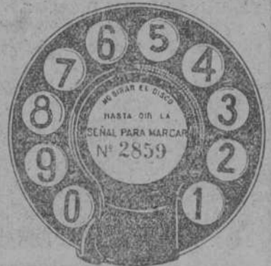
Este es el disco que ha de usar usted para marcar el número.