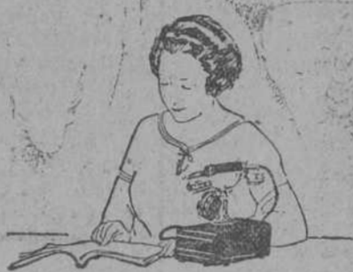
Consulte siempre la Guía antes de marcar. Sólo así obtendrá el número correcto.