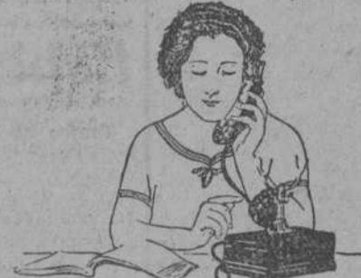
Escuche hasta oír la señal de marcar, que consiste en un zumbido continuo e indica que puede usted hacer la llamada.