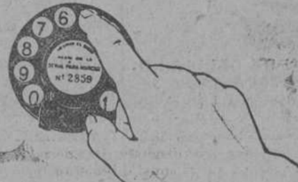
Acción de marcar la cifra 5. Primera fase.

El presente servicio telefónico de Santander será substituído por el sistema automático hacia el día 26 de agosto. Se encarece a los señores abonados y al público en general que tengan presente el hecho mencionado y ayuden a la Compañía en la ejecución del cambio con la molestia y confusión mínimas. ** La Compañía envía representantes suyos a visitar a todos los abonados y explicarles el manejo del teléfono automático. Si alguno desea una visita especial de instrucción, le bastará indicarlo, y en cualquier momento se le enviará un funcionario de la Compañía. ** La nueva Guía contiene instrucciones detalladas para el uso del teléfono automático. En la cara anterior de la cubierta están impresos los números de servicios especiales. Con la introducción del nuevo servicio, será absolutamente necesario consultar la Guía antes de llamar, puesto que se han cambiado todos los números. ** Todos los días se abren estaciones públicas de demostración, desde las cuatro de la tarde a las nueve y media de la noche, en la Central Interurbana, Infantas, 1; Oficinas de Paulino García del Moral, Paseo de Pereda, 7 y 8, y planta baja del Gran Casino del Sardinero.