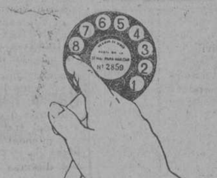
Acción de marcar la cifra 9. Primera fase.