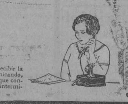
Si el teléfono marcado no puede recibir la llamada por encontrarse comunicando, oírá usted la señal de ocupado, que consiste en una serie de zumbidos intermitentes y muy frecuentes.