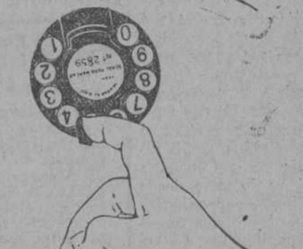
Acción de marcar la cifra 5. Segunda fase.