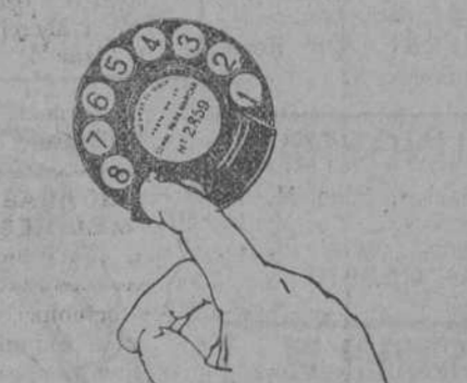
Acción de marcar la cifra 9. Segunda fase.