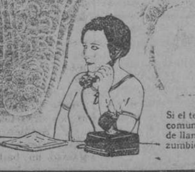
Si el teléfono marcado está libre y puede comunicarse con el suyo, oírá usted la señal de llamada, que consiste en una serie de zumbidos intermitentes y muy poco frecuentes.

El presente servicio telefónico de Santander será substituído por el sistema automático hacia el día 26 de agosto. Se encarece a los señores abonados y al público en general que tengan presente el hecho mencionado y ayuden a la Compañía en la ejecución del cambio con la molestia y confusión mínimas. ** La Compañía envía representantes suyos a visitar a todos los abonados y explicarles el manejo del teléfono automático. Si alguno desea una visita especial de instrucción, le bastará indicarlo, y en cualquier momento se le enviará un funcionario de la Compañía. ** La nueva Guía contiene instrucciones detalladas para el uso del teléfono automático. En la cara anterior de la cubierta están impresos los números de servicios especiales. Con la introducción del nuevo servicio, será absolutamente necesario consultar la Guía antes de llamar, puesto que se han cambiado todos los números. ** Todos los días se abren estaciones públicas de demostración, desde las cuatro de la tarde a las nueve y media de la noche, en la Central Interurbana, Infantas, 1; Oficinas de Paulino García del Moral, Paseo de Pereda, 7 y 8, y planta baja del Gran Casino del Sardinero.