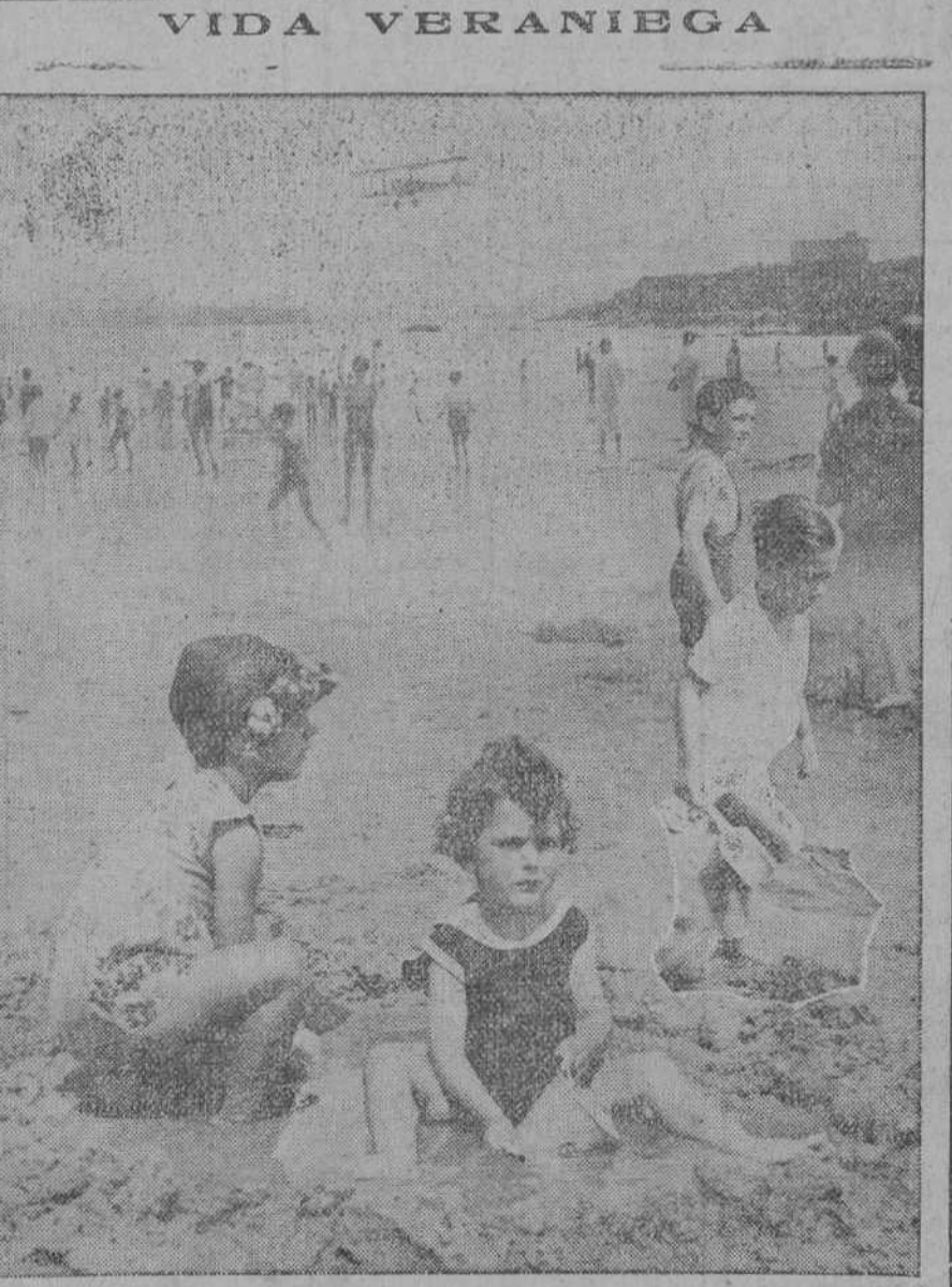
Las encantadoras niñas en la playa.