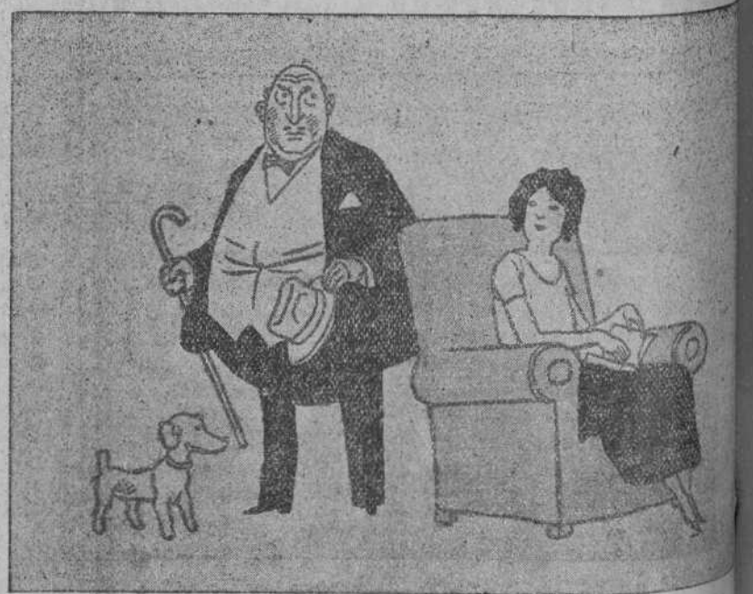
—Si pregunta alguien por mí dí que he ido a pagar los impuestos. —Bueno, pero que no se te olvide pedir al recaudador algún dinero para ir a la compra mañana. (De «Le Figaro», de París)

Vertical text on the far right edge of the page, partially cut off.