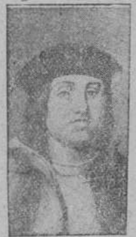
Este célebre capitán español, virrey de Nápoles y de Sicilia, nació en 1466 y murió en el combate de Capo D'Orso (costas de Nápoles) en 1528.