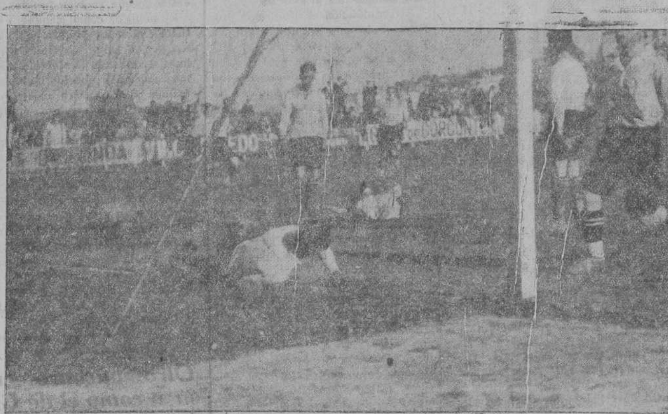
DEL PARTIDO DEL DOMINGO.—Interesante momento de conseguir el tercer tanto los de la Cultural.

A los cuarenta y un minutos, y en un avance por el ala izquierda duranguesa, Salazar da una mano clara.