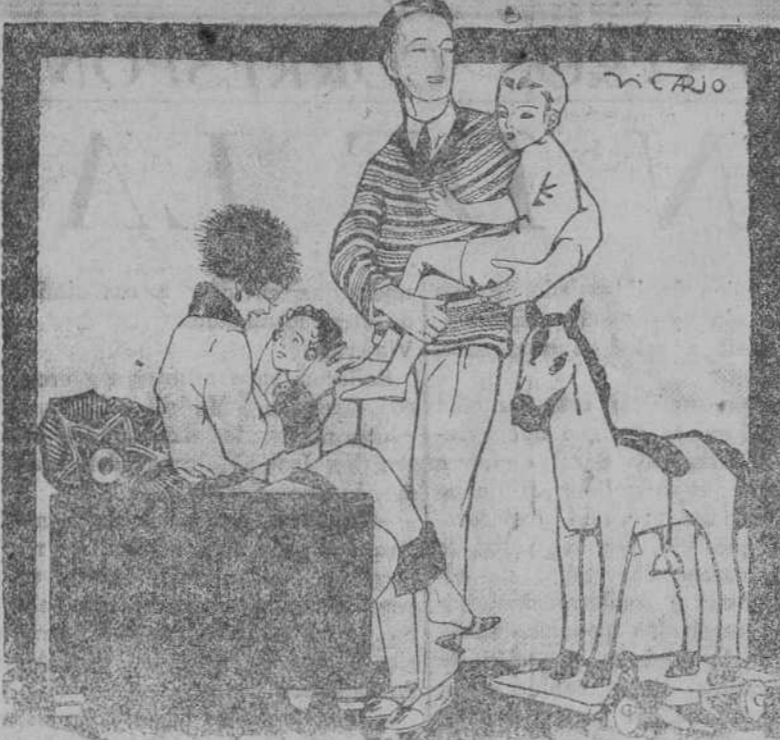
Si, hijo mío, si. Como a tu hermanito, cuando lo necesites, te purgaré con los deliciosos ROMBOS LAXANTES.

«Joven Victoria», de Bilbao, en las 12. «Amada», de Bilbao, con carga general.