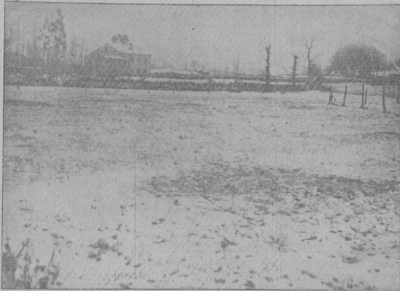
Aspecto que ofrecían los alrededores de la estación de Sarón con motivo de la última nevada.

El martes, y también a las diez de la mañana y en la citada iglesia de Mortera, se celebrarán solemnes funerales costeados por los pueblos de Bóo, Mortera y Liencres.