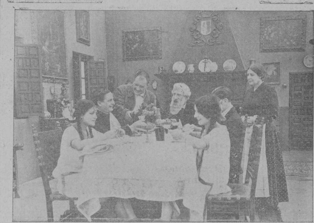
Interesante escena de la película «El Abuelo», pasada en el Gran Cinema.

No se ha vuelto a hablar nada de los proyectos que parecían abrigar las Casas productoras americanas Metro Goldwyn y Universal de instalar estudios en Inglaterra, pero en cambio se