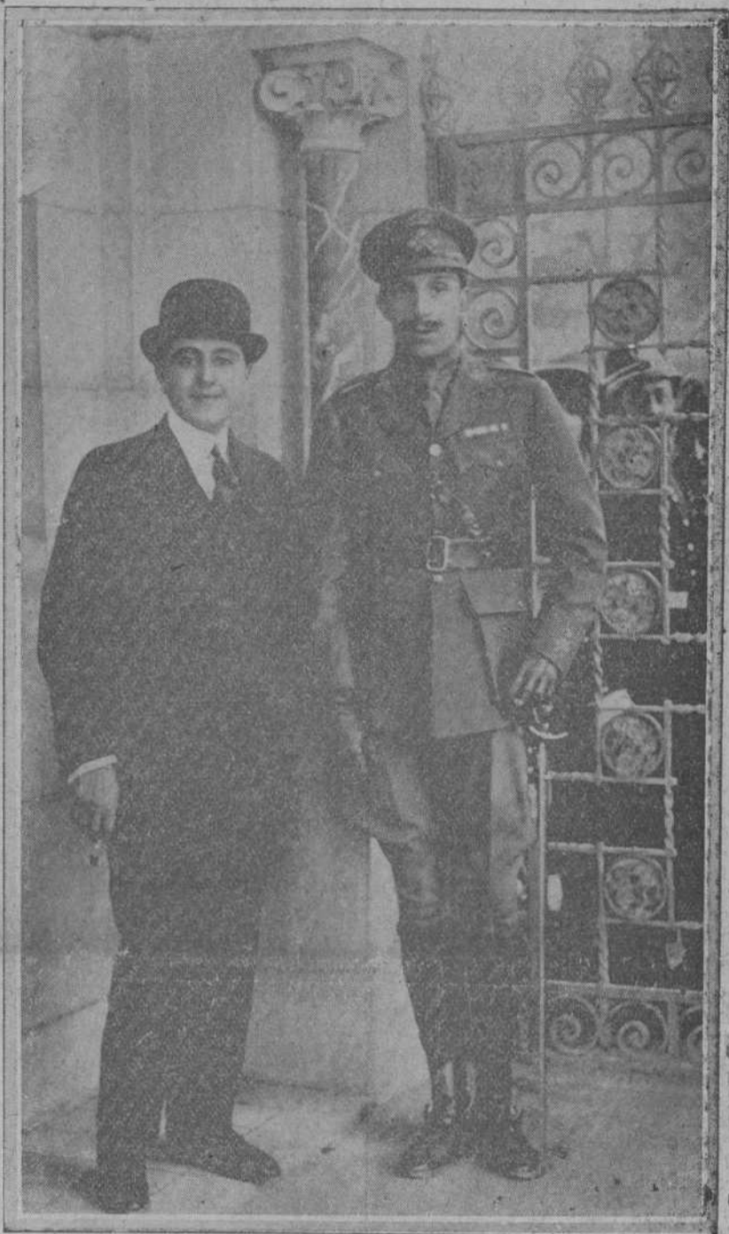
El joven Sha de Persia, que ha sido destronado, acompañado por don Alfonso XIII en la última visita que hizo a España.