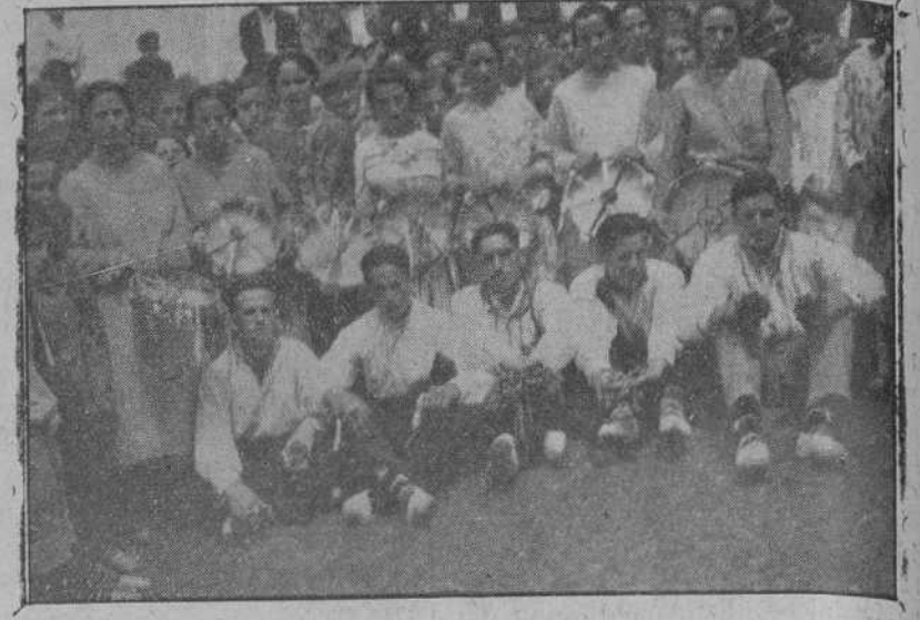
Moza y mozos del pueblo de Tanos que han bailado los «pica-yos» en la romería de Nuestra Señora de las Nieves.

Comparó a García Moreno con Judas Macabeo, a quien, como al caudillo del pueblo judío, podía llamarse varón fuerte, león santo dispuesto siempre a mostrar su prestancia a los enemigos de Dios.