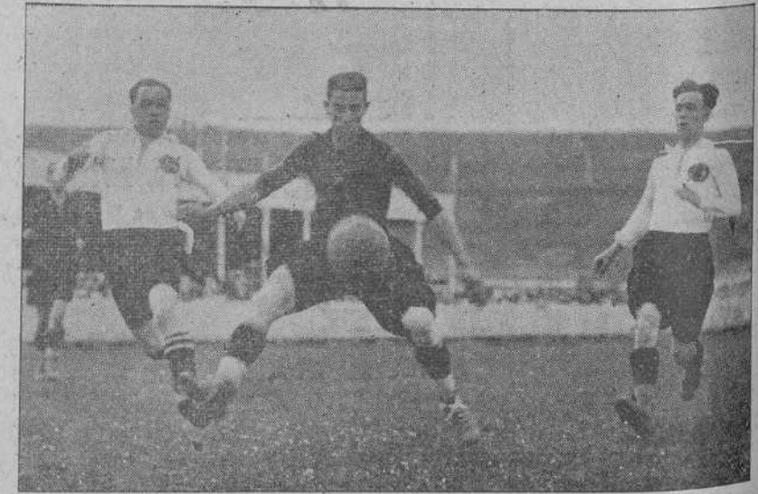
DEL PARTIDO DEL DOMINGO.—UN PASE DE DIEZ A PAGAZA, QUE EL DEFENSA NO PUEDE CORTAR.