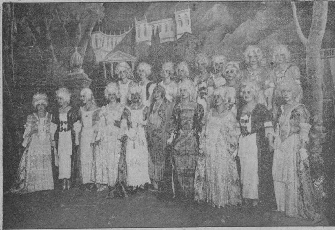
LA FUNCION DE ESTA NOCHE A BENEFICIO DE LA CRUZ ROJA.—GRUPO DE BELLAS Y DISTINGUIDAS SEÑORITAS QUE TOMARON PARTE EN «LAS DOS PRINCESAS».