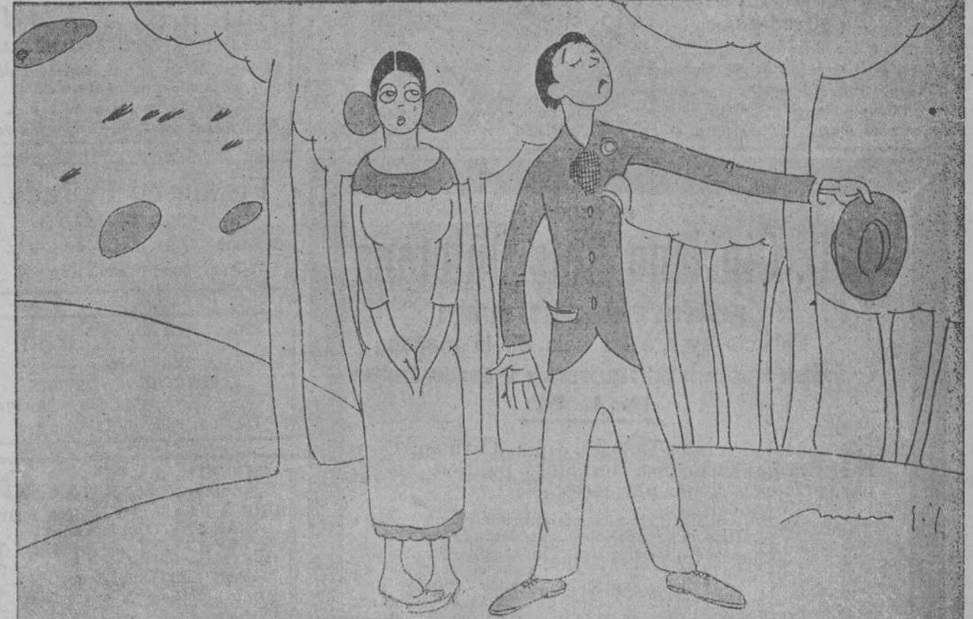
—OH, PRIMAVERA GENTIL, YO QUIERO DIRIGIRTE UN SALUDO!... —BUENO, PERO DATE PRISA EN SALUDARLA Y VAMOS, QUE VA A LLOVER OTRA VEZ.