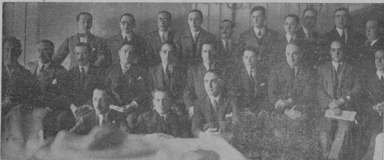
CONCURRENTES AL VINO DE HONOR CON QUE LA ASOCIACION DE LA PRENSA OBSEQUIO A LOS PERIODISTAS DEPORTIVOS LUGAROS CON MOTIVO DEL PARTIDO RACING-REAL SOCIEDAD.