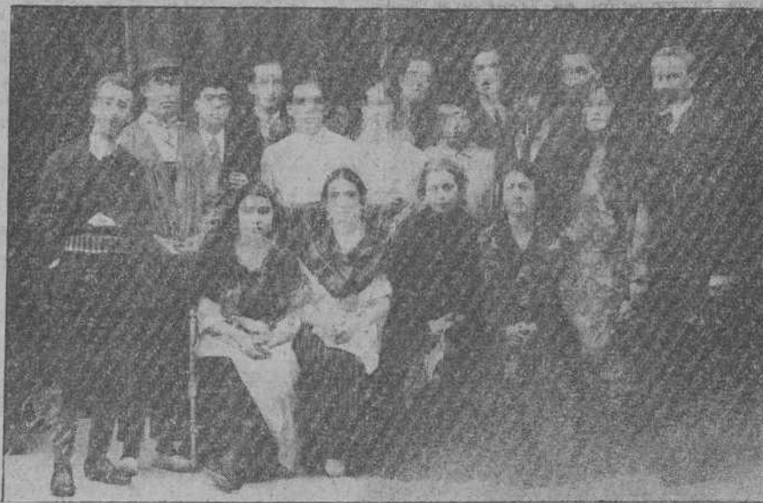
Grupo de bellas señoritas y distinguidos jóvenes, de Comillas, que tomaron parte en la vèluda teatral a beneficio del Aguinaldo del Soldado.

VÍAS URINARIAS, SECRETAS DIATERMIA Moderno tratamiento de la blenorragia y sus complicaciones. Consulta de 11 a 1 y de 3 a 4 y media SAN JOSE, 11, HOTEL