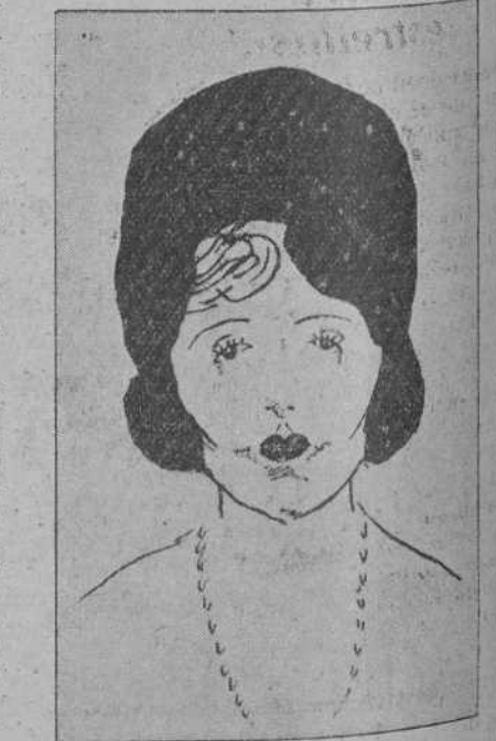
¿A qué actriz cinematográfica pertenece esta caricatura?