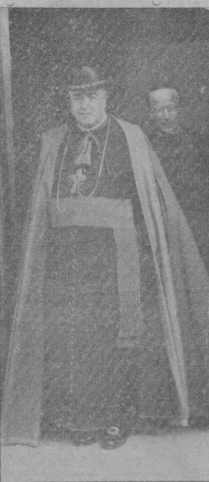
Su Ilustrísima saliendo en la mañana de la inauguración del Ropero Santa Victoria.

Seguidamente el obispo de la diócesis fue inquirendo detalles de la exposición admirando los grandes lotes que se exhiben por secciones parroquiales.