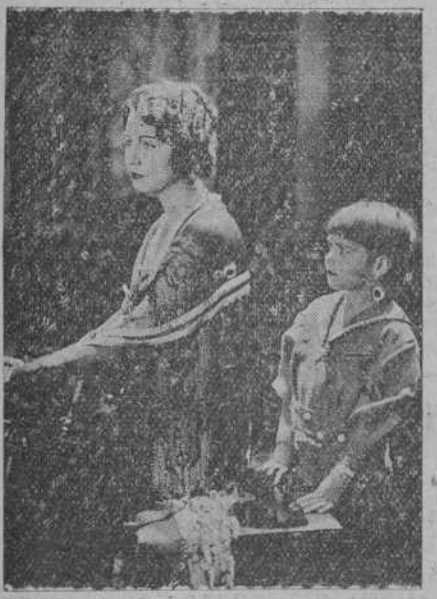
¿A qué película de Dorothy Dalton, pasada en la Sala Narbón, pertenece esta escena?

tudio, y mientras unos periódicos aseguran que, en la actualidad, la famosa artista se encuentra de nuevo en California, impresionando bajo la dirección de William de Mille las primeras escenas de una nueva producción titulada «Amor de cada día», otros dicen que Nita se ha puesto a tratamiento para adelgazar rápidamente, añadiendo algunos interesantes detalles de su severo régimen, tales como el tomar dos tazas de té en ayunas y no volver a probar otra cosa hasta el mediodía, en que hace, de pie, un almuerzo frugal, manteniéndose así hasta la hora de acostarse, en cuyo momento vuelve a tomar otras dos tazas de té.