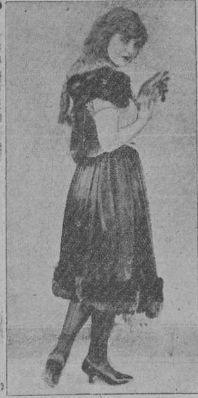
MARY MILES MINTER, la famosa actriz americana que condensa los dos valores positivos: arte y belleza.

Ahí tenemos bien patente el caso de Nita Naldi, de la genial «star», a la que pronto tendremos la suerte de admirar en «Los diez Mandamientos». Su obesidad la tiene alejada del es-