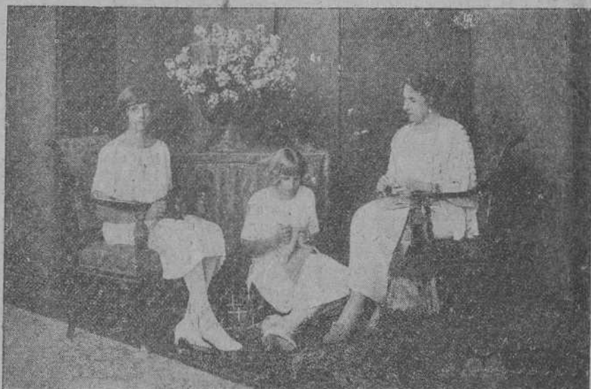
A la vez que nuestras distinguidas damas y bellísimas jóvenes trabajan sin descanso en Santander para llevar a efecto la gran obra social creada por Su Majestad la Reina, de vestir a los niños pobres, la propia y augusta Soberana, en unión de sus hijas doña Cristina y doña Beatriz, confecciona las ropitas que figuran en la exposición del Roper, instalado en la residencia de los Padres Jesuitas.

Doña Victoria y Sus Altezas, trabajando para los niños sin amparo dan una alta prueba de caridad que no puede por menos de ser recogida por las nobles damas españolas que, como nuestras distinguidas convecinas, realizan todos los años, por esta fecha, la obra de misericordia de vestir al desnudo.