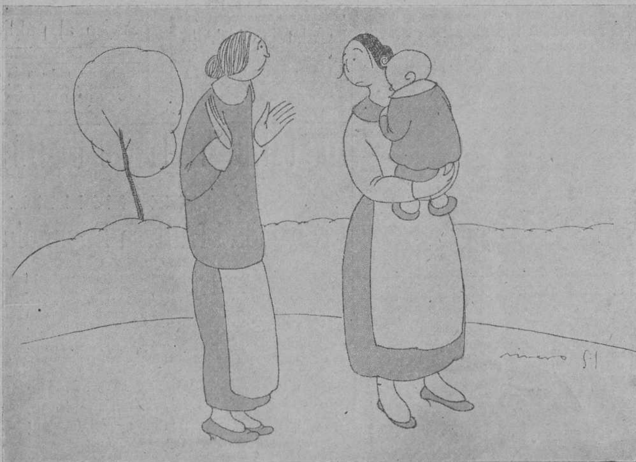
—Fijate si será rara que no sale de casa más que cuando llueve. —¡Pues, hija, también son ganas de hacer el patio!...