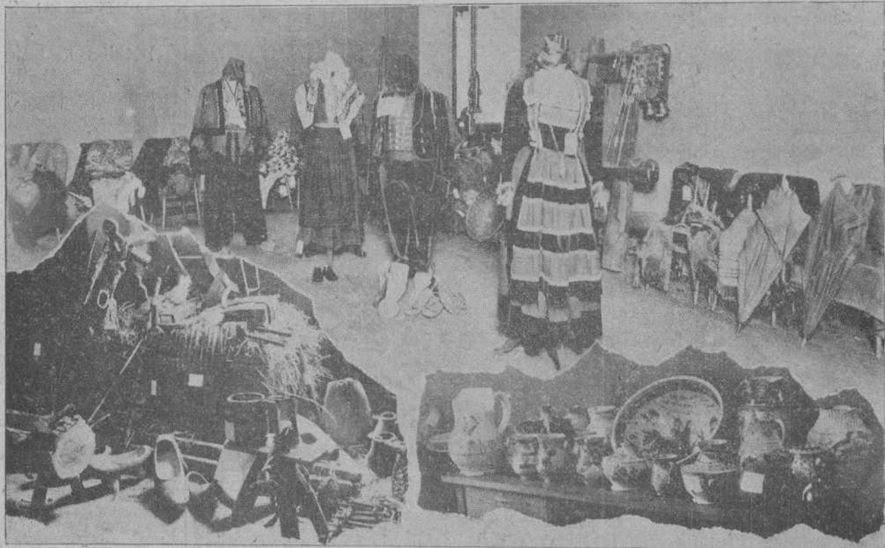
Los vestidos y objetos montañeses coleccionados por el Ateneo y que serán enviados a Madrid para que figuren en la Exposición de trajes regionales.

El Juzgado ha notificado a esta la ratificación de su auto de procesamiento.