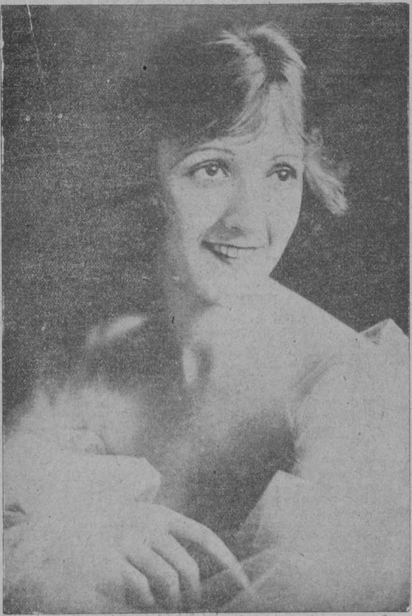
La bellísima Constance Talmadge, sutil creadora de los personajes picarescos de la alta comedia de la pantalla norteamericana.

Interpretados por Marion Davies, son un alarde de riqueza y de presentación fastuosa. El último, del «Programa Ajuria Especial», es una fidelísima adaptación de la conocida obra del insigne dramaturgo don José de Echegaray, y está interpretado por Alma Rubens, que encarna el papel de Teodora, y por Montagu Love, que interpreta el de don Julián.