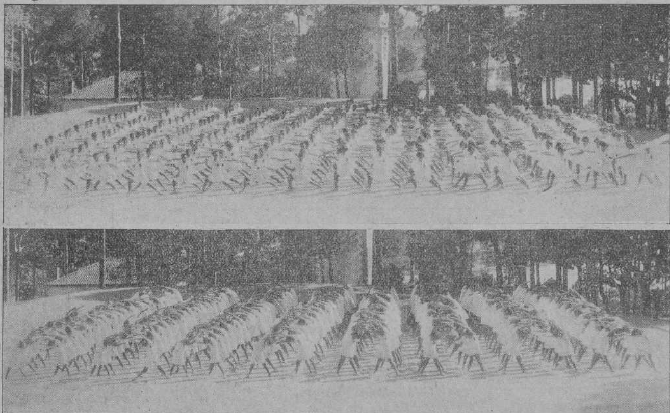
EN EL SANATORIO DE PEDRO SA. Los niños y niñas durante los ejercicios de gimnasia al aire libre.

Asociase EL PUEBLO CÁNTABRO a las manifestaciones de simpatía y afecto recibidas por el señor Blanco Villanueva, lamentando que su estado de salud no le haya permitido seguir prestando sus servicios de administrador de Rentas públicas.