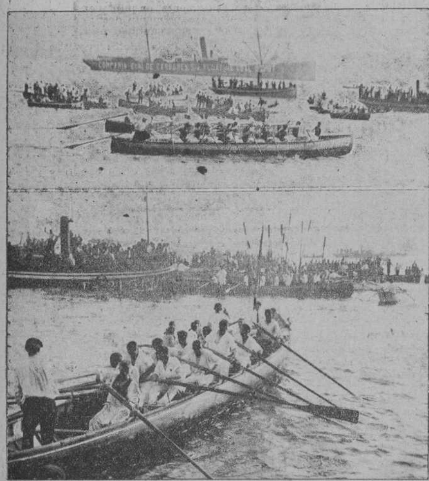
DE LAS REGATAS DE TRAINERAS.—Salida del segundo grupo y las lanchas ganadoras rodeadas de embarcaciones.

emocionantísima. Laredo y las dos de Castro se esforzaban por alcanzar el primer puesto. Sus partidarios hacían sonar los silbatos de las lanchillas, queriendo darles ánimos. Y con los gritos de los incondicionales que ocupaban los botes, traineras, lanchas, etcétera, formaban un griterío ensordecedor. Laredo enfiló primero; a un segundo la «Joven Lola», de Castro, y rendidos por el último esfuerzo cruzó las balizas la «Castreña». Bello espectáculo por todos conceptos y lástima que nuestra pobre pluma sea tan insignificante para elogiarla.