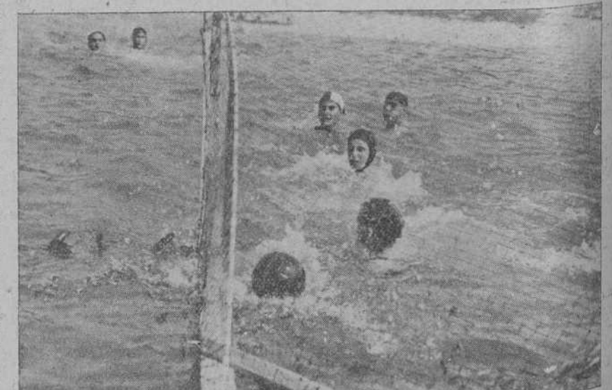
DEL CONCURSO DE WATER POLO.—Uno de los «goals» logrados por el Racing en el partido final jugado contra el Daring.

La emoción que reinó en los últimos 100 metros de la lucha entre las embarcaciones de la primera serie fué