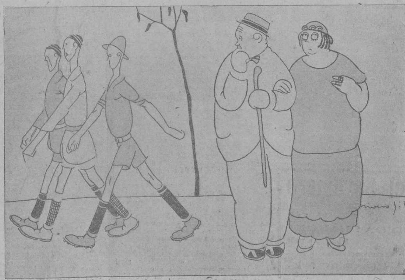
—¡Ay, Efigenio! ¡Que tiempos aquellos en que nosotros estábamos así de delgados!...