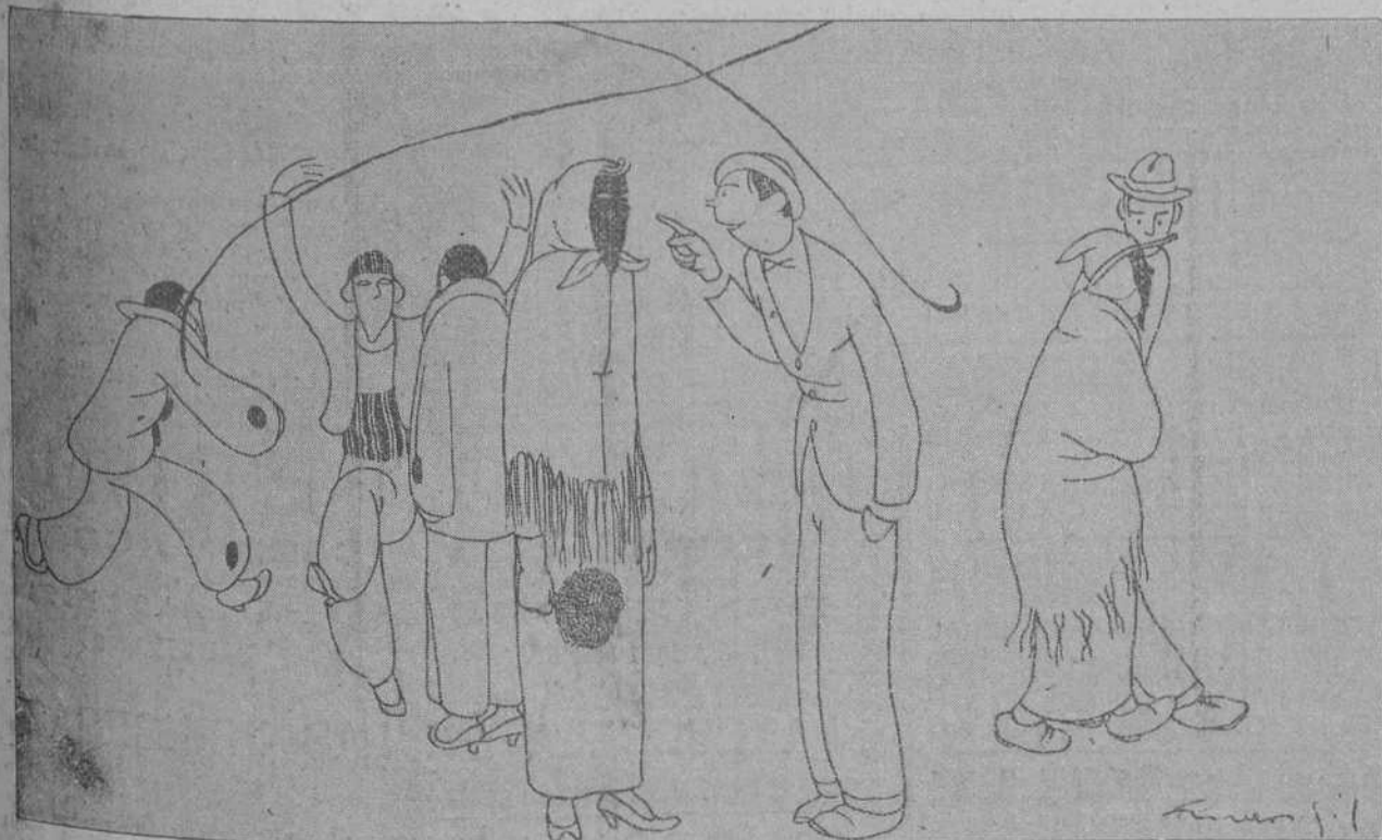
—¿Que no te conozco? ¡Pero, mujer, si a vosotras se os conoce mejor con la cara tapada!..