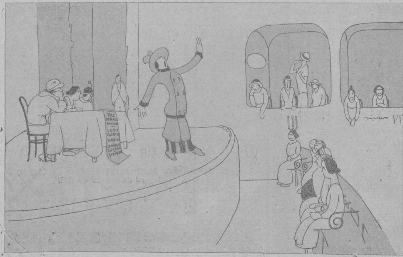
—¿QUERIS SABER NUESTRO PROGRAMA? PUES QUE TODAS NOS CASEMOS!..