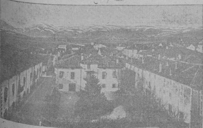
POBLACIONES MONTANESAS.—Reinosa: barrio de las Heras.

Los opositores se muestran satisfechos por la justicia que se ha hecho, desglosando estas oposiciones de la