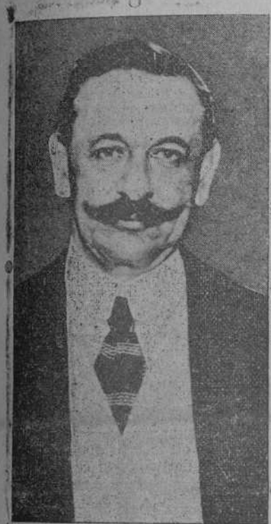
El presidente del Consejo, señor marqués de Alhucemas, procesado, según declaraciones del general Primo de Rivera, por no haber separado del Gobierno al señor Alba.

Los militares no quieren gobernar; desean sólo purificar el ambiente político y piden al pueblo hombres para formar un Gobierno. —En el documento-programa de Primo de Rivera se llama a Alba "depravado y cínico ministro".—Los militares se han incautado en Barcelona de todos los centros públicos.—Amplia y sensacional información.—Hoy llega el Rey a Madrid.—Se ha declarado la huelga general en toda España.