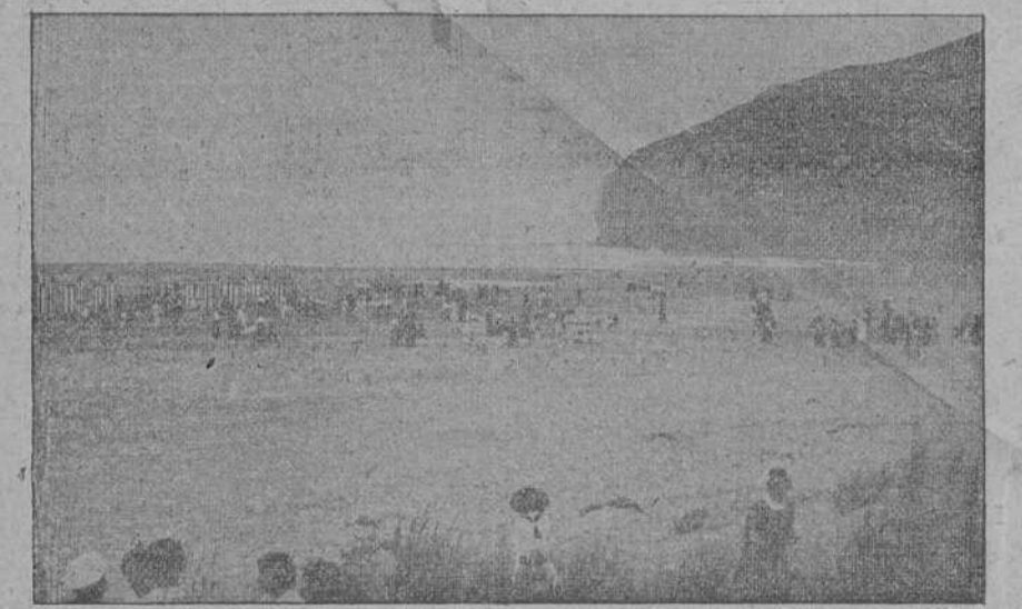
Vista parcial de la magnífica playa de Berria.

La procesión saldrá a las diez en punto, antes de celebrarse la misa parroquial y en ella tomarán parte todos los elementos de Santoña, militares y civiles, religiosos y profanos, autoridades y pueblo. Abrirán la procesión una escuadra de batidores de Artillería del 12 peñado a caballo, con montura de gala; otra a pie, la banda de trompas a caballo y un piquete de diez artilleros. A continuación, la cruz parroquial y detrás de ella, todos los niños con trajes de cardenal. A ambos lados, y en dos filas, los niños del Colegio de Manzanedo, con