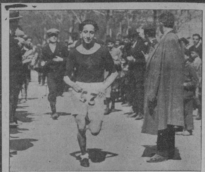
EL EX CAMPEÓN DE ESPAÑA JULIO DOMÍNGUEZ, GANADOR DEL CAMPEONATO CASTELLANO LE «CROSS» CELEBRADO EN MADRID EL DOMINGO, ENTRANDO EN LA META