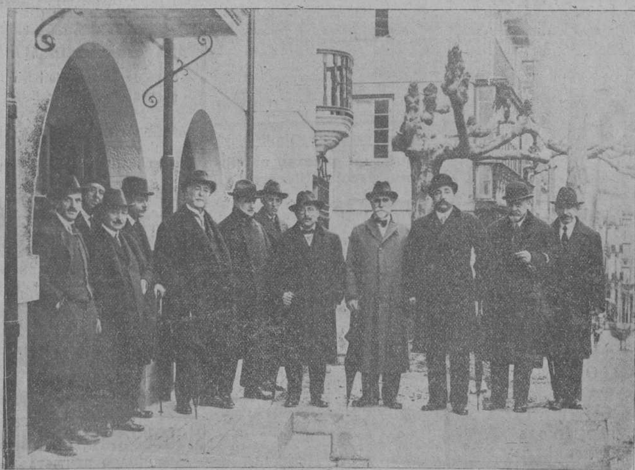
AUTORIDADES Y PERSONALIDADES QUE ASISTIERON A LA ENTREGA DEL NUEVO EDIFICIO DE LA GOTA DE LECHE, COSTEADO POR LA COLONIA MANTONESA EN CUBA

Toda la correspondencia política y literaria, dirijase a nombre del director, Apartado de Correos, 62