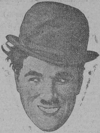
CHARLIE CHAPLIN, A QUIEN QUIEREN ADJUDICAR LA «INSIGNIFICANCIA» DE POLA NEGRI