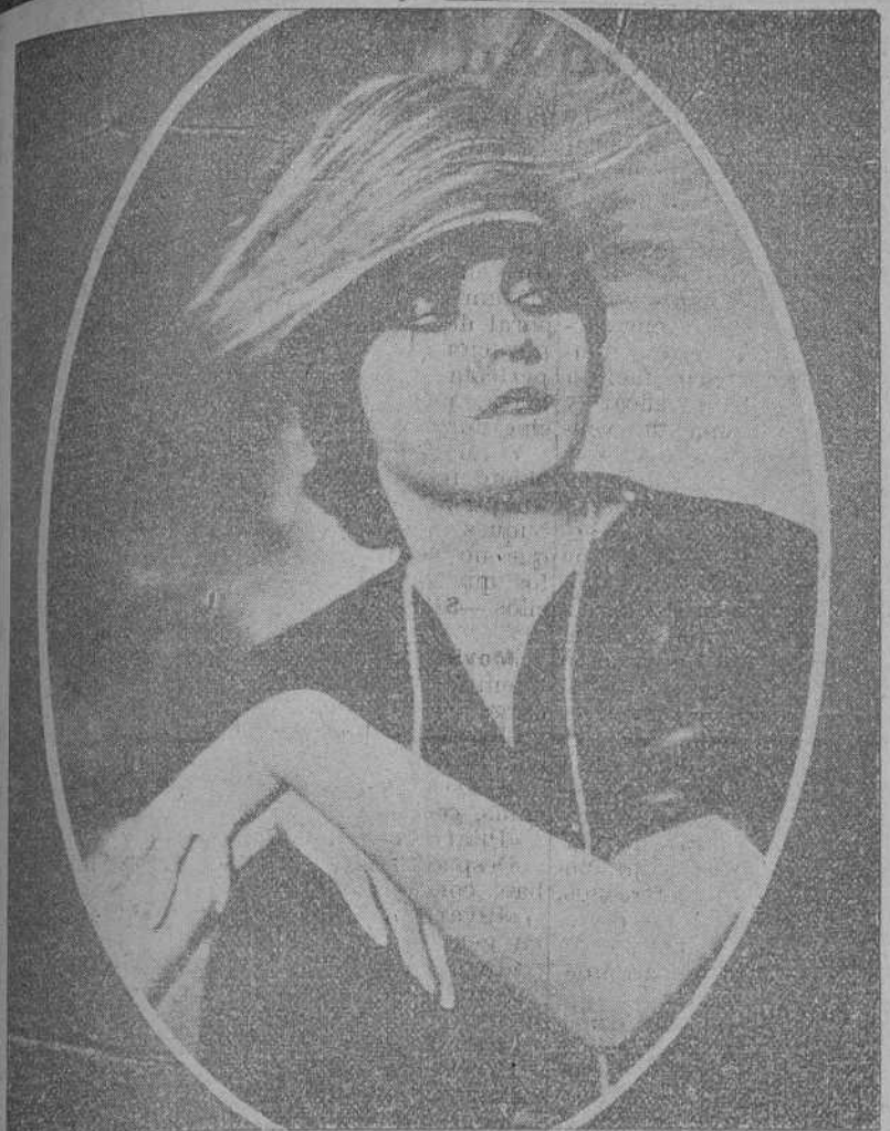
POLA NEGRI, LA BELLA ACTRIZ DE LOS SUGESTIVOS OJOS Y DISCUTIDA NOVIA DE CHARLOT