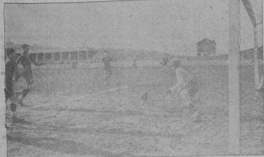
PARTIDO DE CAMPEONATO «ECLIPSE»-«SIEMPRE ADELANTE».-Un buen club, muy colocado, que Crespo no pudo parar, proporcionó al «Siempre Adelante» su primer tanto.

EM. S. R.) S. arto. origi. s pases stocada. mole. dno su. gundo ación a gregia. con las, entre. RDOSA. le Soto. Media. Agabeno. mata de. ño ha. aba con. m vol. ARJO. han di. complica. a curar. nta que. o señor. o mala. al le in. de cue. ocho de. glave. i trasta. señor. sociación. ander se. diagrama. sia pro. y mi ad. Prensa. niente de. labida. to ideal. fiesta en. nuestra. espiritual. a la vez. erias de. arán un. erra fir. salud. directiva. ensa, se. i, al que. on Angel. de ayer. x goben. dor José. no efusi. lga. Se. montañes. to a de. s intere. ruzo en. deho de. ue fuera. na. www. a ho. ha 8 del. o-Podro. egado de. io de las. men, ha. número. las gra. do a di.