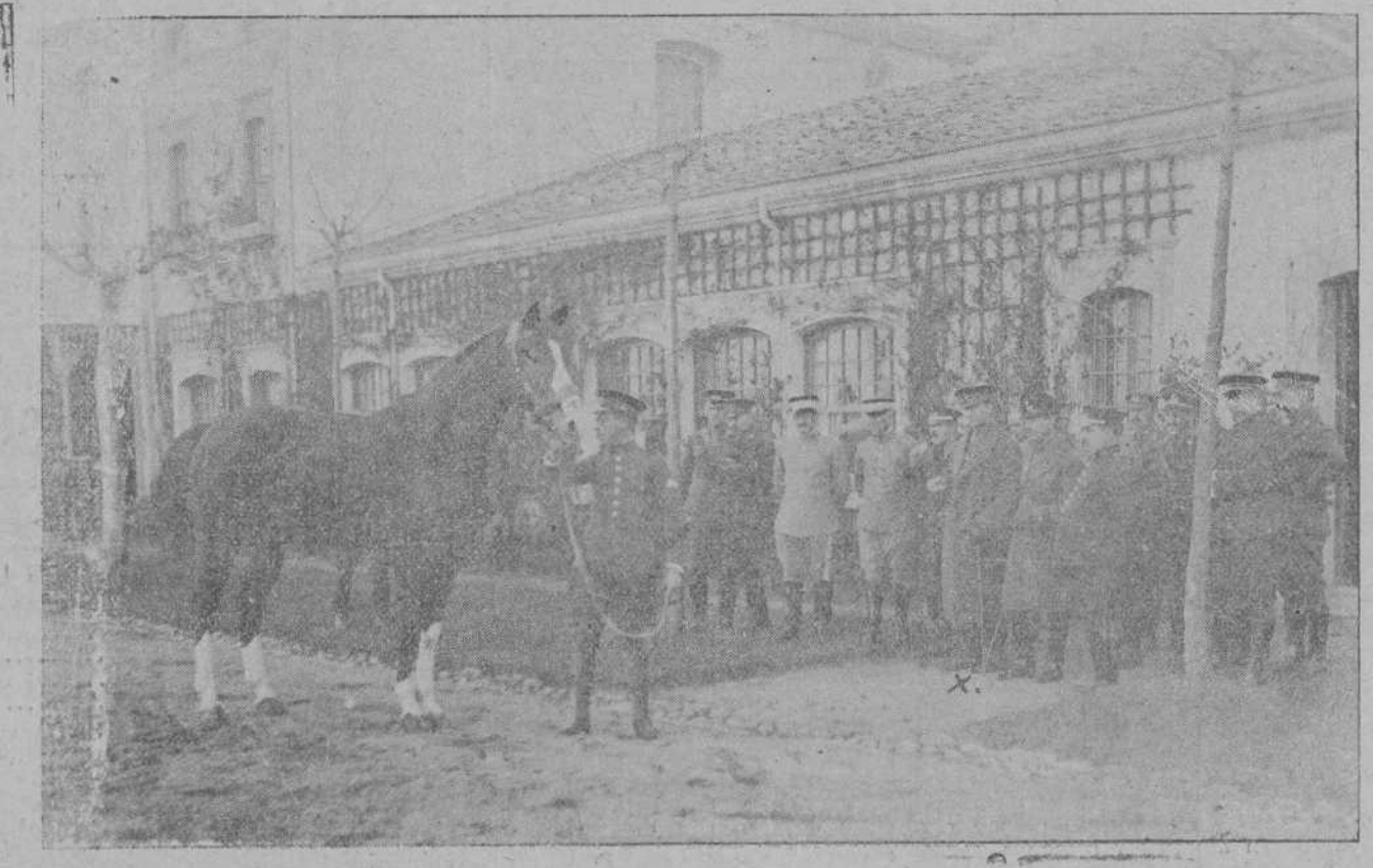
EL INFANTE DON FERNANDO (X) PASANDO REVISTA A LOS MAGNÍFICOS EJEMPLARES SEMENTALES DE LA REMONTA, EN CAMPOGIRO.

Los «blancos» que se han pasado al fascismo son mucho menos numerosos; lo que prueba la superior organización de los católicos. El devenir del sindicalismo en Italia se presenta hoy, pues, bajo dos formas principales: la fascista y la católica.