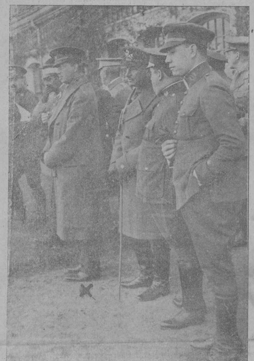
EL INFANTE DON FERNANDO (X) DURANTE LA VISITA DE INSPECCION QUE GIRO AYER MAÑANA AL DEPOSITO DE LA REMONTA, DE CAMPOGIRO

En ellos hay una escuela para niños y una sección de la institución «Gota de Leche».