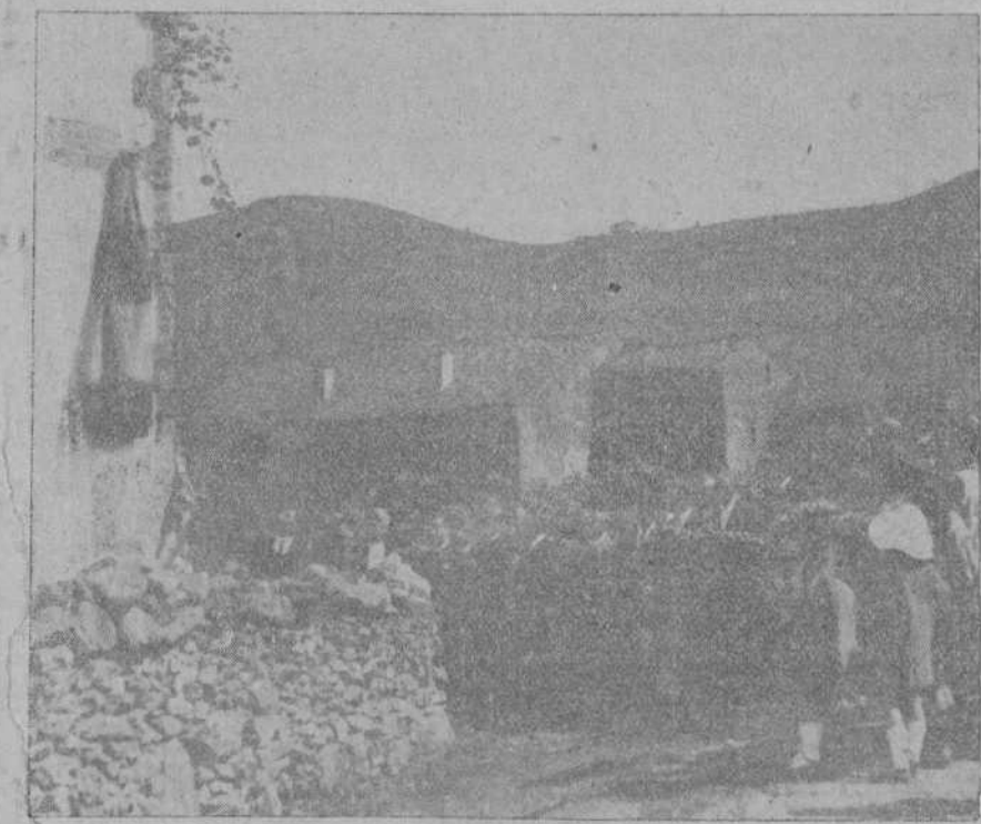
EL DOMINGO EN RIAÑO.—Momento de descubrir la lápida que da el nombre del marqués de Valdecilla a una de las calles del pueblo, en agradecimiento por el regalo de unas escuelas.

Terminó señalando la reforma que pudiera introducirse para reducir la tutela del Estado respecto de los organismos provinciales y municipales. Fué muy aplaudido.