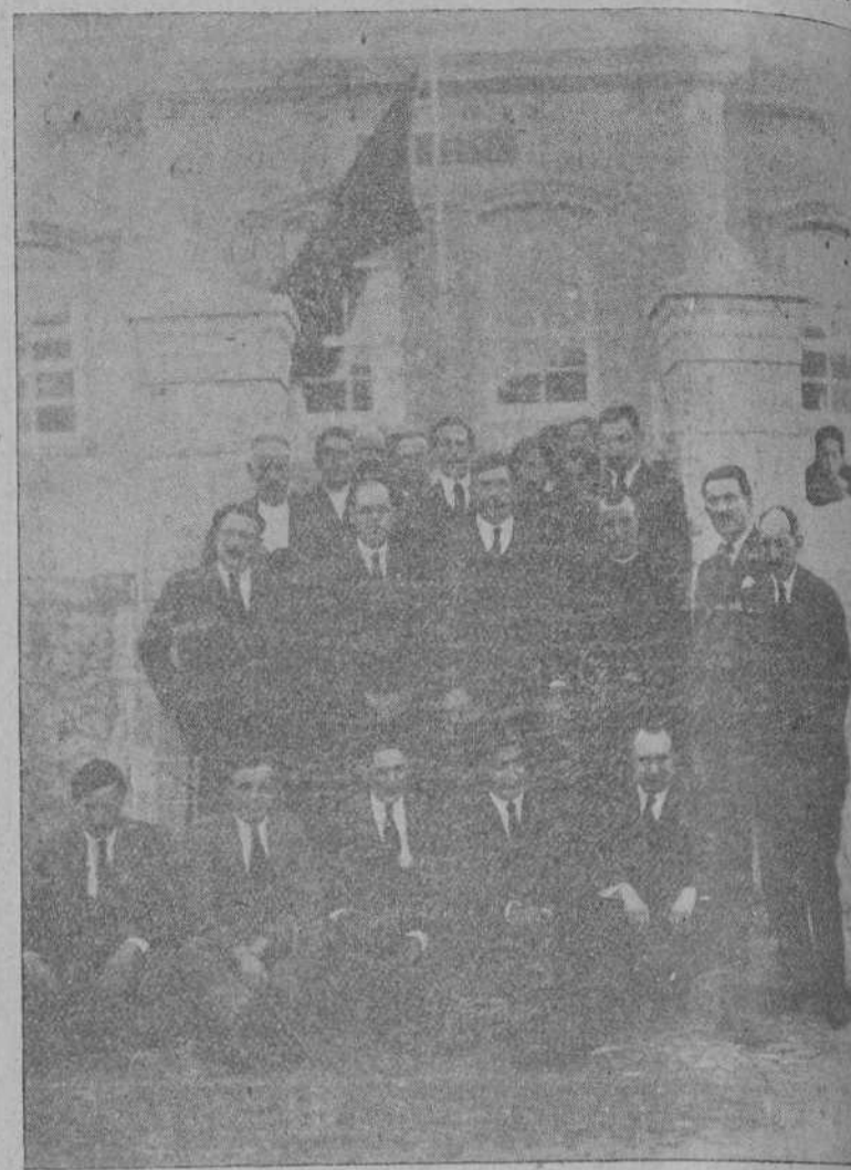
Autoridades y maestros invitados al acto de inauguración de las Escuelas donadas al pueblo de Riaño por el marqués de Valdeciella.

El embajador se negó a responder directamente, alegando su falta de instrucciones; pero, a juzgar por su