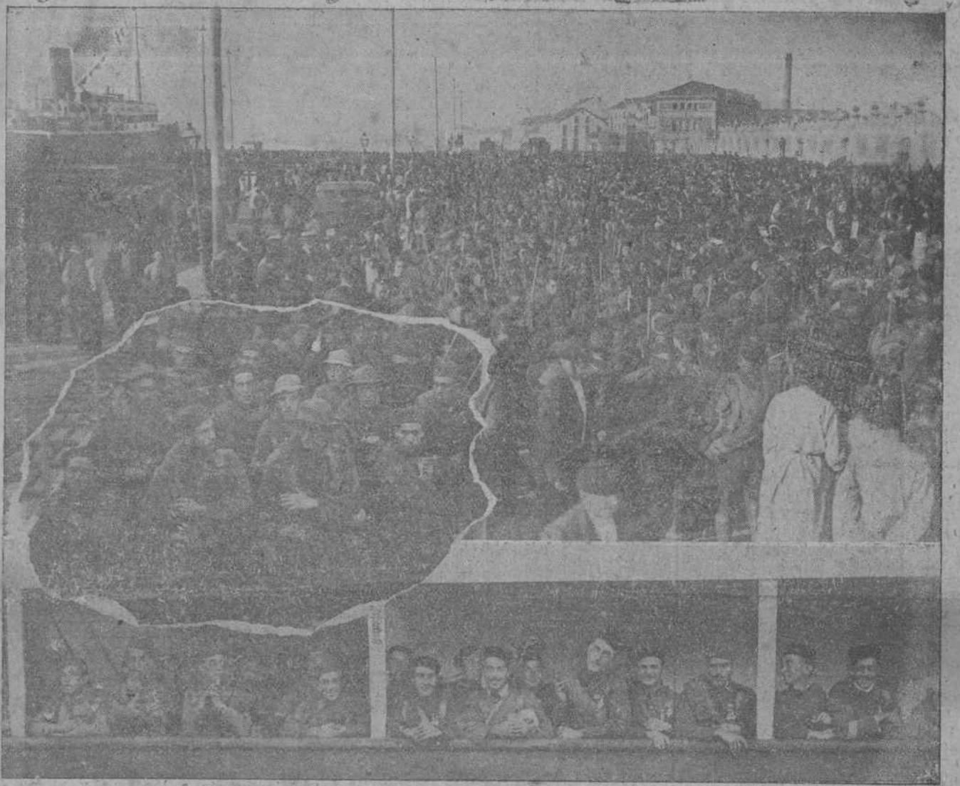
Aspecto que ofrecían en la mañana de ayer los alrededores del muelle núm. 1 al desembarcar las fuerzas expedicionarias. Los soldados a bordo del «Capitán Segarra» y del «Romeu» momentos antes del desembarco.

Puede decirse que, a pesar de lo intempestivo de la hora, más de medio Santander, se había lanzado a la calle, ansiosa de presenciar la entrada en él de los soldados victoriosos.