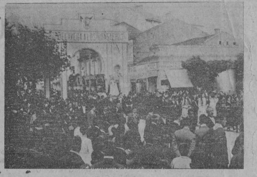
DE TORRELAVEGA.—La procesión pasando bajo el arco levatado a la entrada de la ciudad.