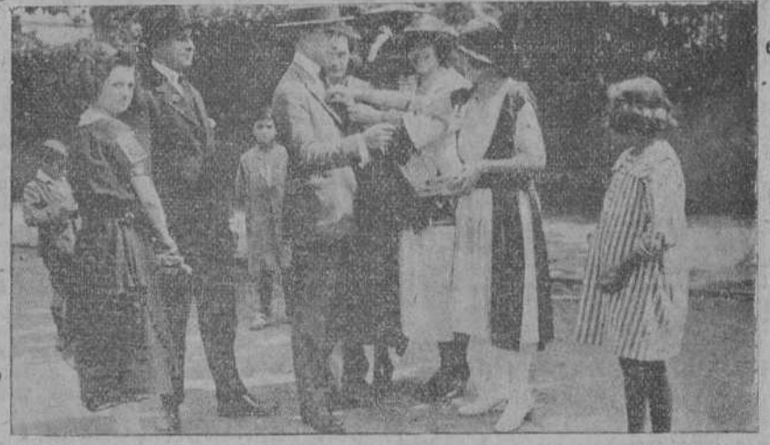
DE TORRELAVEGA.—Distinguidas señoritas que postularon en la Fiesta de la Flor, verificada ayer.—Lindas postulantes asaltando a unos jóvenes.