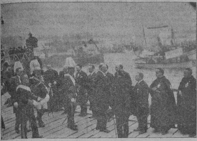
LOS CONCEJALES SANTANDERINOS DAN LA BIENVENIDA AL PRESIDENTE ARGENTINO