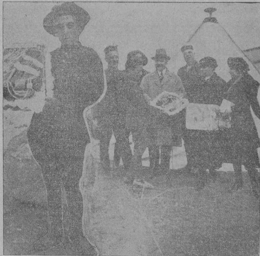
haciendo entrega al cornetín del batallón de Valencia del magnífico mozapán que le llevaban como regalo desde Santander.—El cornetín, feliz con su rico regalo.

Lo sucedido fué que el citado barco corrió un violentísimo temporal y que cinco de sus hombres, creyéndose perdido, sin consultar a nadie escaparon en uno de los botes de salvamento, que fué el encontrado con un cadáver y que dió origen a que se supusiera que había naufragado.