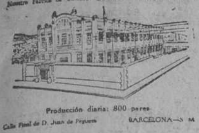
Producción diaria: 800 pares. Calle Pineda de D. Juan de Paredes. BARCELONA—S. M.

Compañía Nacional de Piel y Calzados S. A.