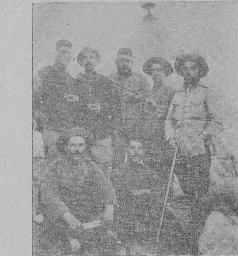
Voluntarios de Valencia, reunidos el día de la Pazina con algunos compañeros de Wad-Rás.

Por disposición del excelentísimo señor ministro de la Gobernación, conde de Cosío de Portugal, este benéfico establecimiento será atendido por el gobernador civil, aunque, desde luego, será común la obra de la patriótica idea entre el resto de las autoridades de la capital.