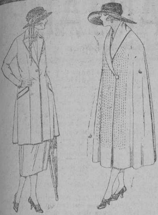
Trajes de sarga inglesa, cheviot, en negro, azul y color, de ptas. 140 a 200.

SUCURSALES: Madrid, Barcelona, Alicante, Almería, Bilbao, Cádiz, Cartagena, Gijón, Granada, Málaga, Palma de Mallorca, Sevilla, Valencia, Valladolid, Zaragoza.