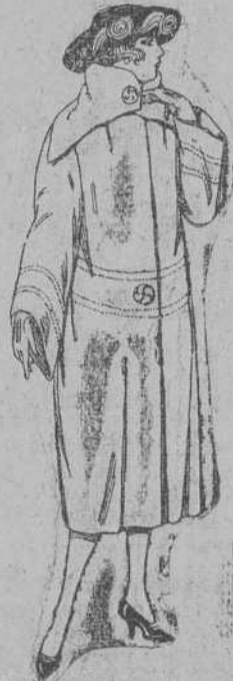
Abrigos de terciopelo de lana, ratina, etc., en negro, azul y color, adornos pespunte de seda, de ptas. 110 a 200.