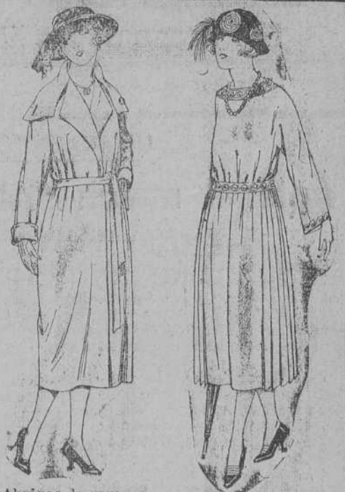
Abrigos de gamuza, cheviot, etc., en negro azul y color, de pta. 50 a 100.