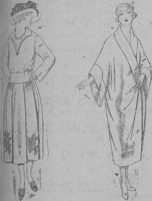
Vestidos de sarga inglesa, estambre, etcétera, en negro, azul y color, adornos bordados a mano, de ptas. 100 a 140.