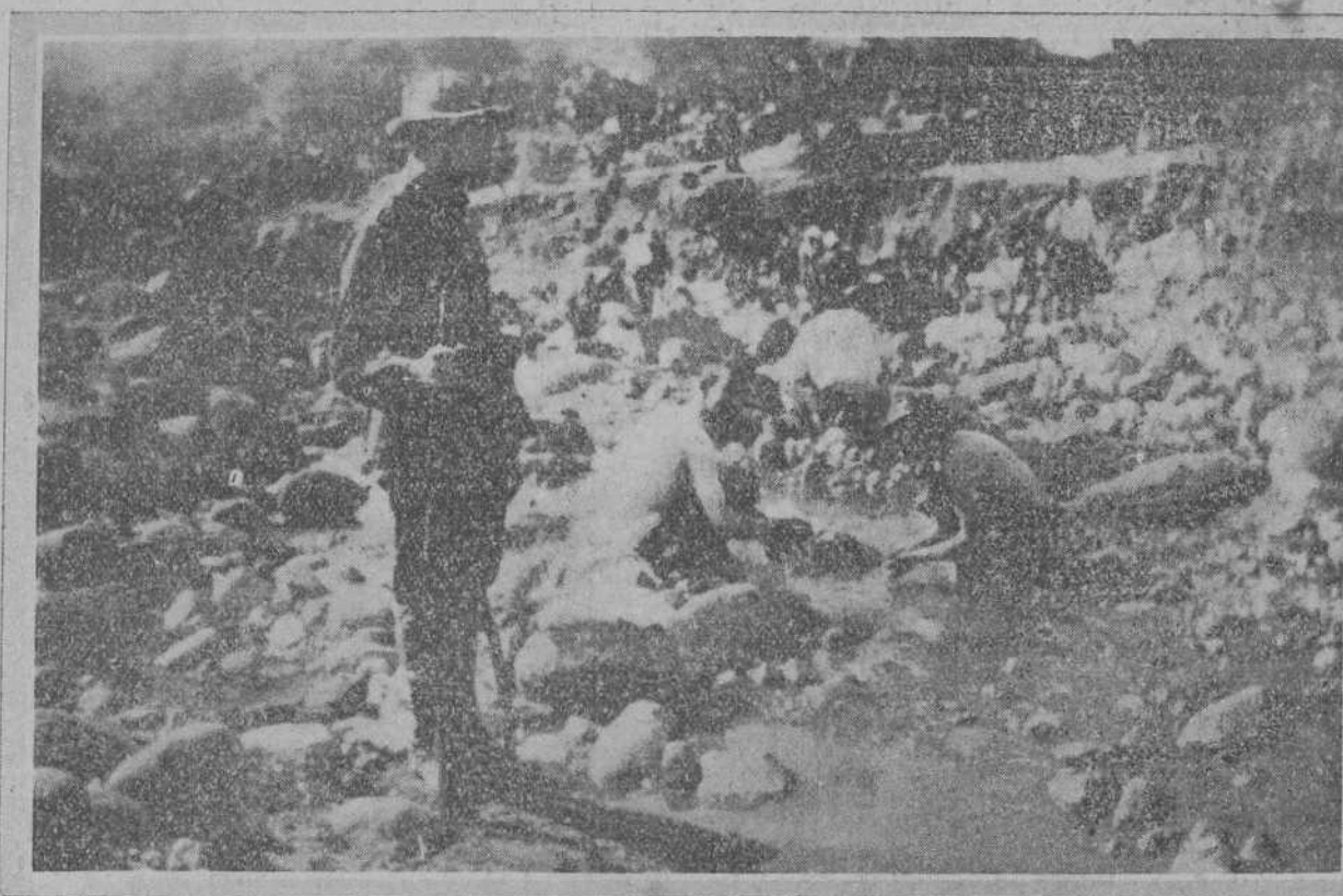
ESCENAS DE LA GUERRA.—Expedicionarios del batallón de Valencia lavándose en un riachuelo, protegidos por soldados del mismo batallón.

LA OPINION DE TRES ALMIRANTES LONDRES.—Interrogados los almirantes ingleses acerca de la Conferencia de Washington, han manifestado lo siguiente: El almirante Peroy Scott dice que, en razón a las nuevas condiciones de la guerra naval y aérea, la construcción de los buques de guerra es una política loca. Los cuatro acorazados, de los cuales la construcción está ya proyectada en el programa naval, costará, contando las transformaciones que habrá que hacer en los acorazados, cerca de 100 millones de libras. Esto sería una excelente cosa, si nosotros pudiéramos dispensar de este gasto a un país bien castigado por la guerra. El almirante Mark-Kerr ha manifestado: —Yo estoy de acuerdo con los principales generales. Yo creo que la proposición, según la cual el tonelaje de los grandes acorazados debe ser utilizado como la medida de la potencia naval de los tres países forma una base excelente para la discusión. Yo apruebo igualmente el abandono de la construcción de acorazados que están ya en los astilleros o que figuran en los proyectos o programas navales. Nosotros tenemos bastantes grandes buques para Europa; y aquellos que estén en los mares extraños pu-