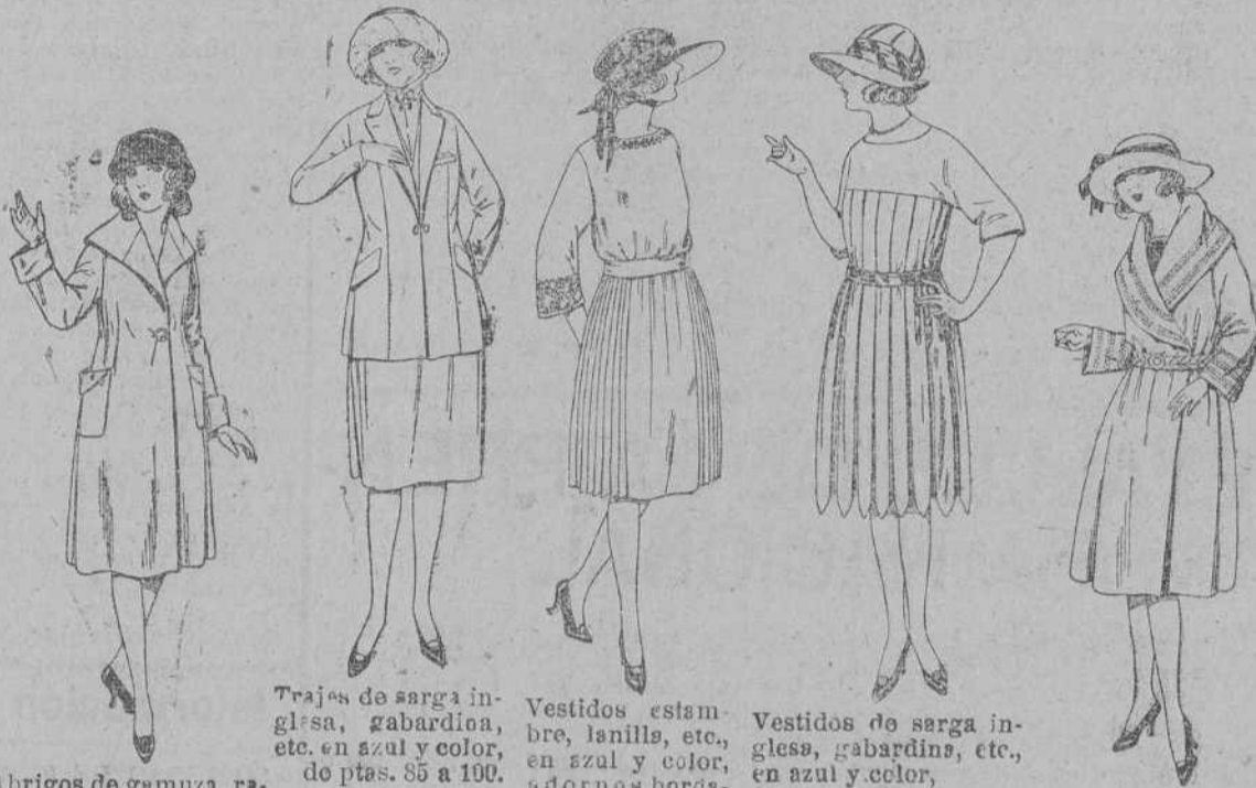
Abrigos de gamuza, ratina, etc., en azul y color, para jovencitas de 12 a 15 años, de ptas. 35 a 50.