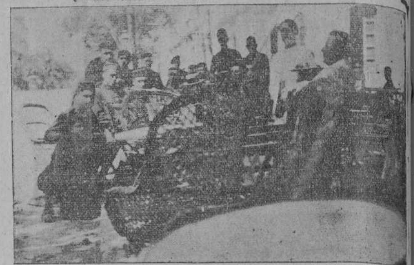
ALMERIA.—Soldados del batallón de Valencia, sentados en la terraza de un café.

El concurso de clasificación celebrado oficialmente el pasado domingo y que se terminará el próximo, tiene por objeto establecer una clasificación de los tiradores en un número de categorías que la Comisión organizadora habrá de definir en su día. A base de estas categorías