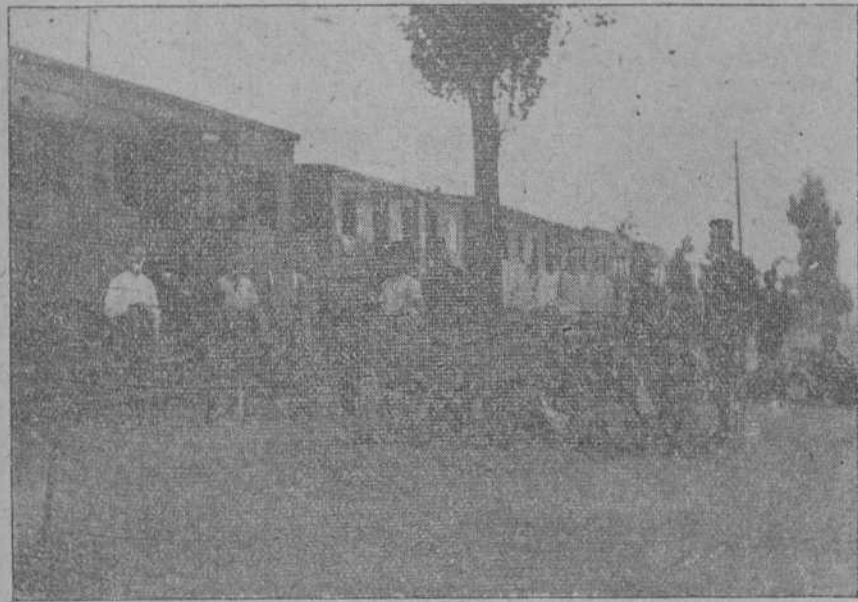
DEL VIAJE DEL BATALLÓN DE VALENCIA.—La parada del tren en una estación próxima a Almería fué aprovechada por algunos soldados para afeitarse.