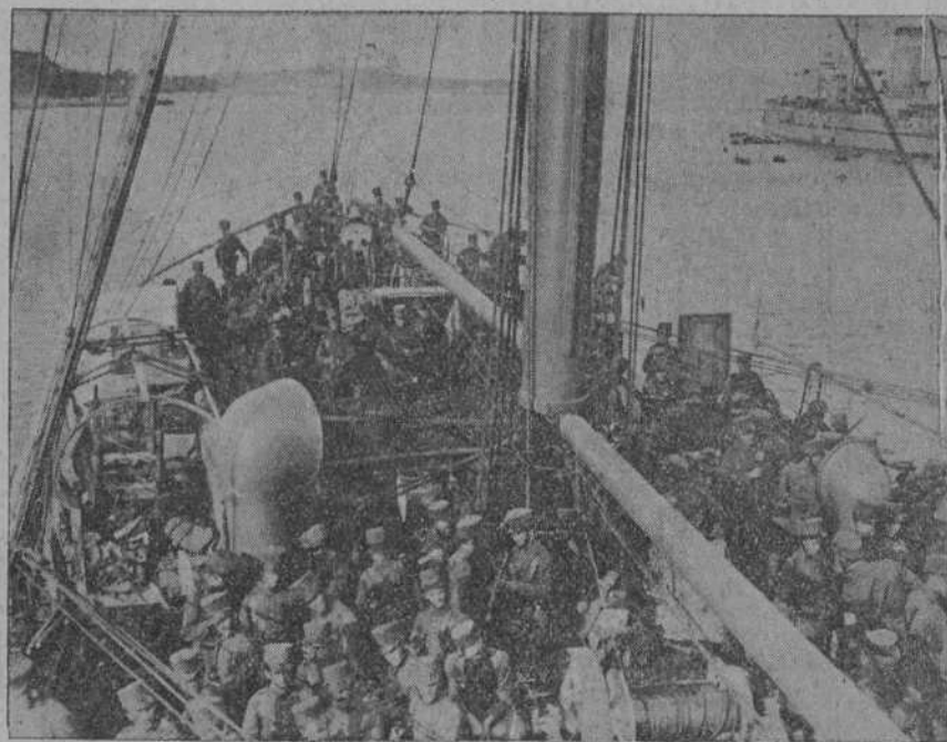
LLEGADA DE TROPAS.—Los soldados del regimiento de Cantabria, la proa del vapor «Andalucía», que les conduce a Marruecos.