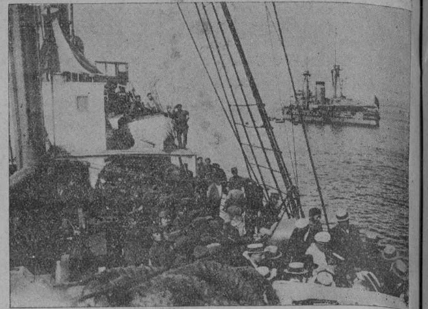
Las autoridades santanderinas entrando a bordo del «Andalucía» para saludar y obsequiar a los soldados del regimiento de Cantabria.