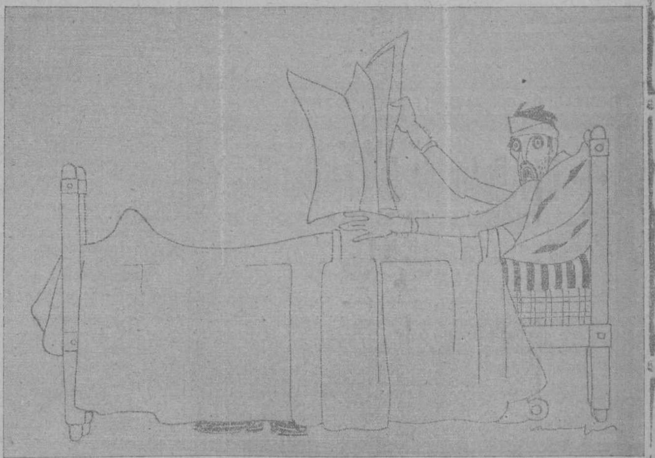
EL ENFERMO.—[Esto es una vergüenza! Planas y más planas para lo de Marruecos y, en cambio, seis líneas para la fauna de Belmonte! ¡Y luego quieren que apogresemos!