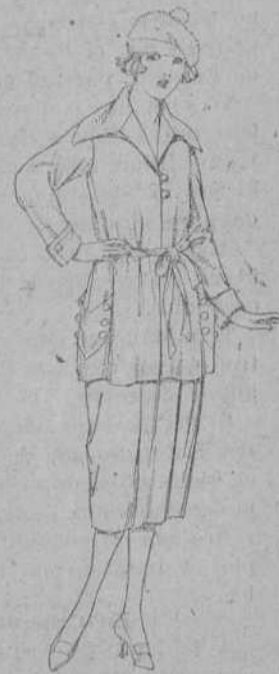
Palétois de tricot de seda, en negro, azul y color, de ptas. 55 a 198.

Ropas confeccionadas para caballero, señora, niño y niña.