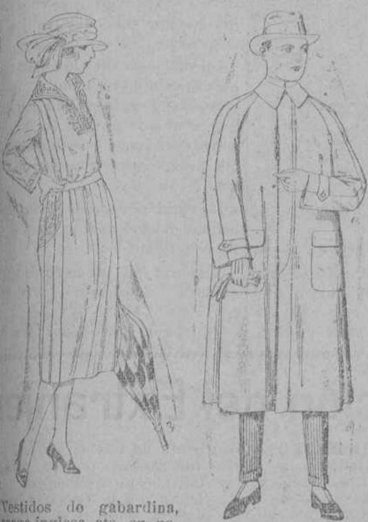
Vestidos de gabardina, sarga inglesa, etc., en negro, azul y color, adornos bordados, de ptas. 110 a 130.