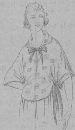
Blusas de crepón de seda, voile y etamin estampado, de pesetas 4 a 25.