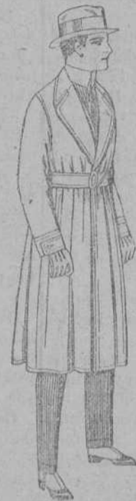
Gabanes impermeabilizados con cinturón «American trench coat», de ptas. 210 a 350.