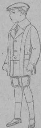
Trajes modelo «Sport», de lanilla, estambre, melton, etcétera, para niños de 4 a 9 años, de ptas. 30 a 48.