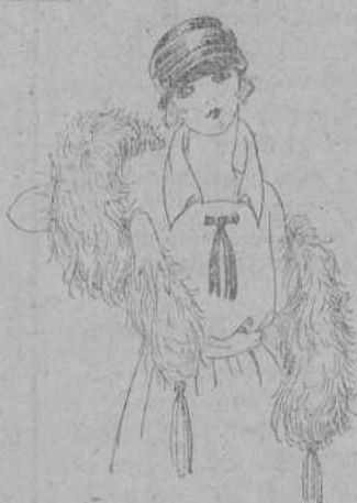
Boas de plumas avestruz, gran variedad en colores y tamaños, de pesetas 15 a 25.