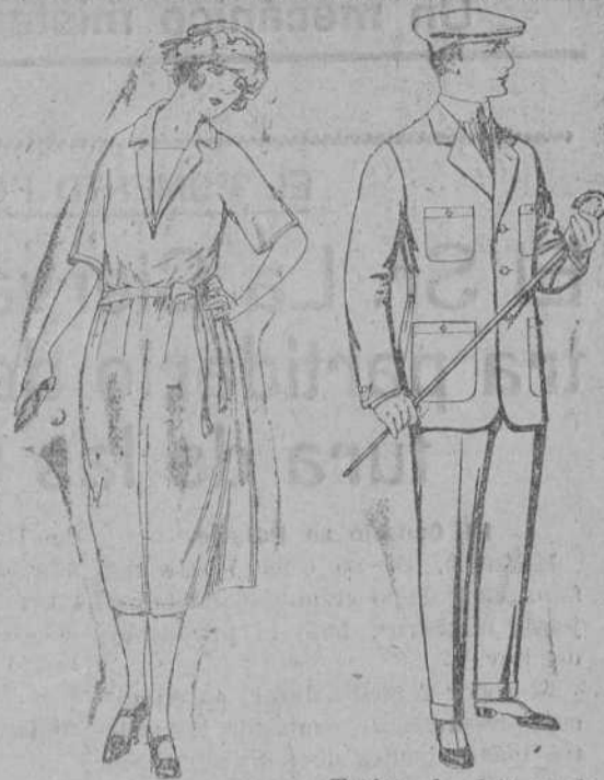
Vestidos de punto de seda, en negro, azul y color, de ptas. 180 a 230.